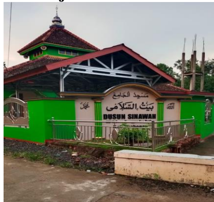
Gambar 10 Masjid Dusun Sinawah

Filosofi gambar Masjid yang di dalamnya terdapat mimbar juga memiliki arti seperti suatu tempat untuk membersihkan jiwa dari penyakit hati. Dengan adanya filosofi gambar Masjid pada karnaval Desa Sinawah sejatinya ingin menunjukkan peran serta fungsi pada masjid. Peran dan fungsi masjid menurut Desa Sinawah antara lain yaitu sebagai tempat ibadah, sebagai tempat menuntut ilmu, sebagai tempat pembinaan umat, sebagai pusat dakwah dan kebudayaan dan sebagai pusat kaderisasi umat.