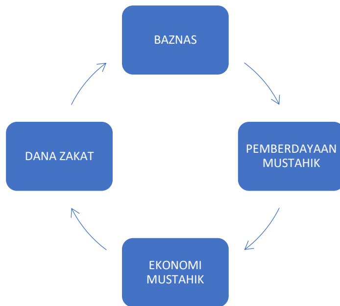
Gambar 2.1 Kerangka Pemikiran