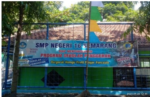
Dokumentasi Sekolah Penggerak