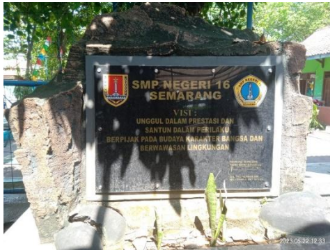
Dokumentasi Visi SMP Negeri 16 Semarang