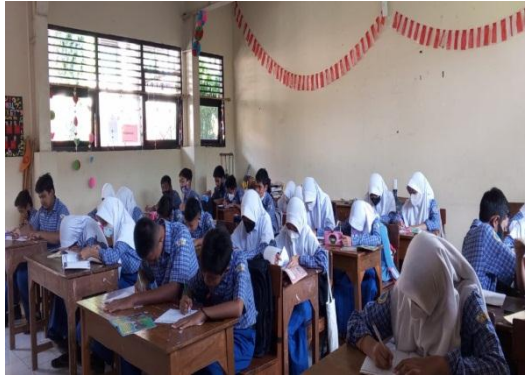
Kegiatan Proses Pembelajaran