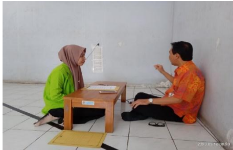
Dokumentasi Wawancara kepada Guru Pendidikan Agama Islam SMP Negeri 16 Semarang