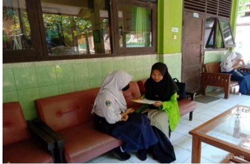
Wawancara Siswa Kelas 7