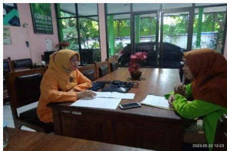
Dokumentasi Wawancara Kepada Waka Kurikulum SMP Negeri 16 Semarang