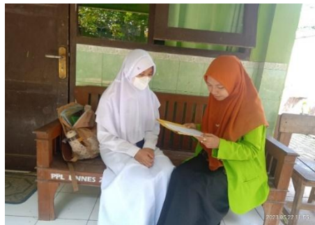
Wawancara Siswa Kelas 7