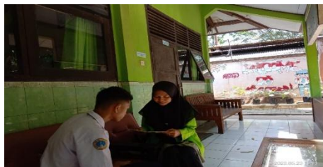
Wawancara Siswa Kelas 7