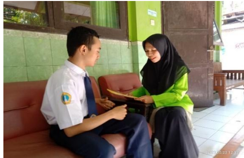
Wawancara Siswa Kelas