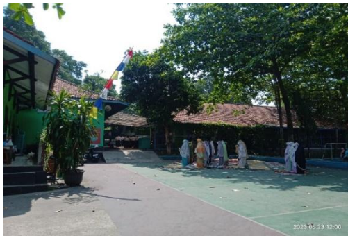
Dokumentasi Wajib Sholat Dhuhur berjamaah dalam menerapkan Profil Pelajar Pancasila