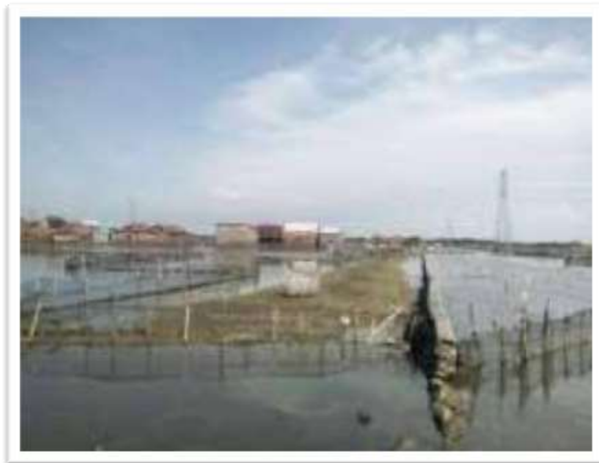
Gambar 2. Tambak di Desa Sidogemah