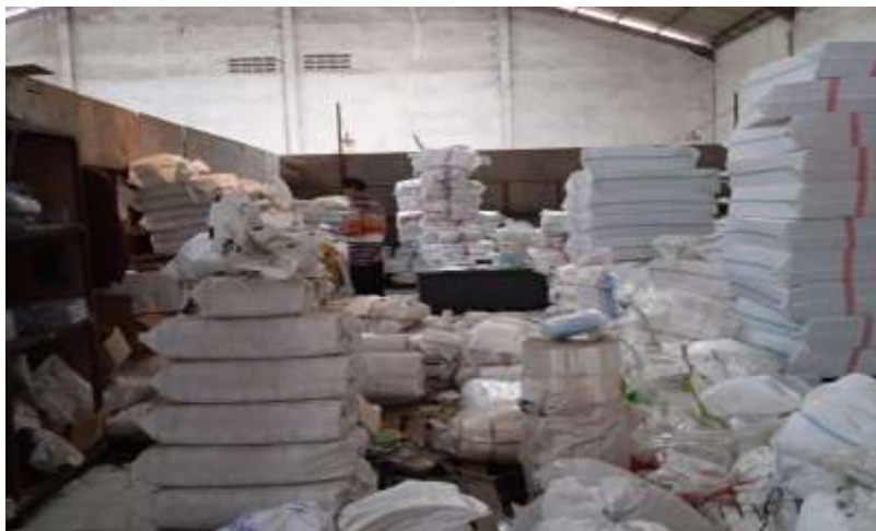
Gambar 5. Bagian QC di PT. Maju Kaya Rejeki