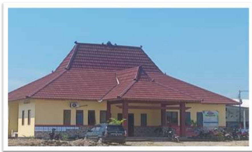
Gambar 3. Kantor Kelurahan Desa Sidogemah