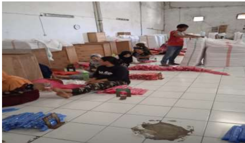
Gambar 4. Bagian Kemas Produksi di PT. Maju Kaya Rejeki