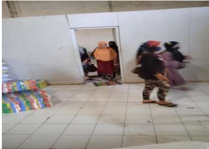
Gambar 6. Buruh Pabrik Pulang Bekerja