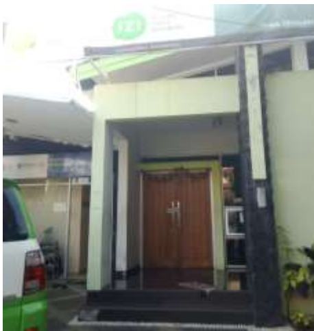
Tampak Depan RSP IZI