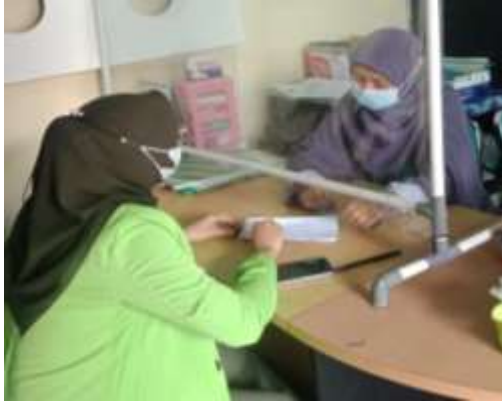
Wawancara dengan petugas RSP IZI