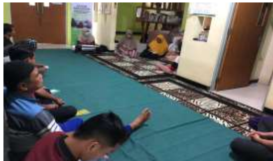
Kegiatan Dzikir Bersama