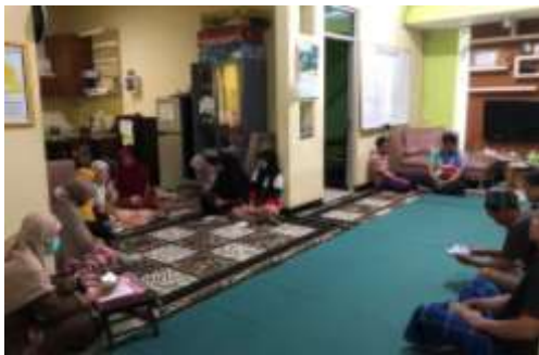
Kegiatan Kajian Islami