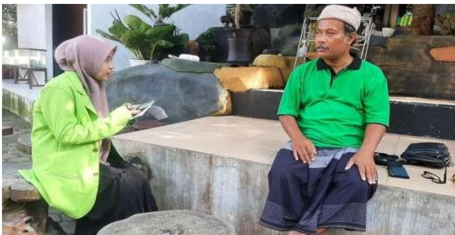
Wawancara dengan ketua sekaligus pengasuh Panti Asuhan Manarul Mabur Semarang