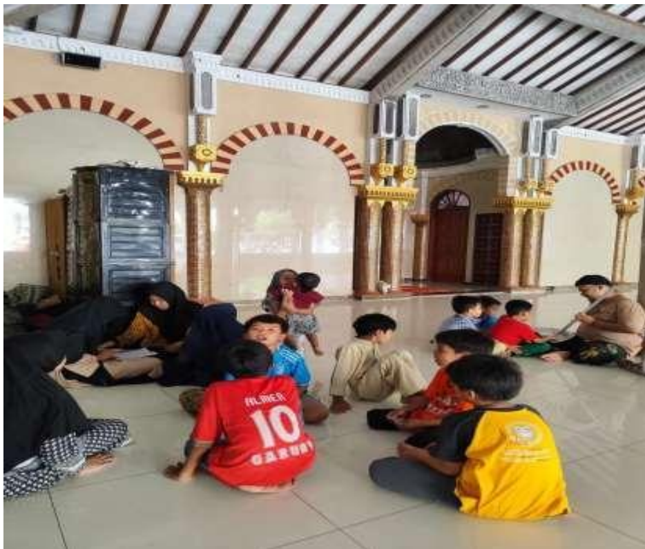
Kegiatan Mujahadah setelah sholat maghrib