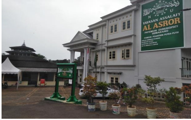
صورة 2 : أنشطة تعليم علم النحو في فصل الرابع بمدرسة الأسرار الدينية السلفية