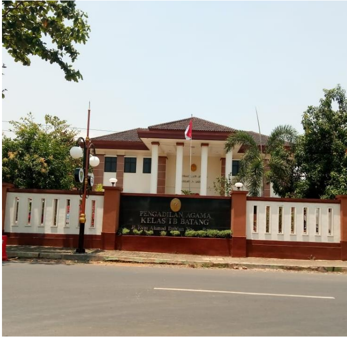
Suasana Depan Pengadilan Agama Batang.