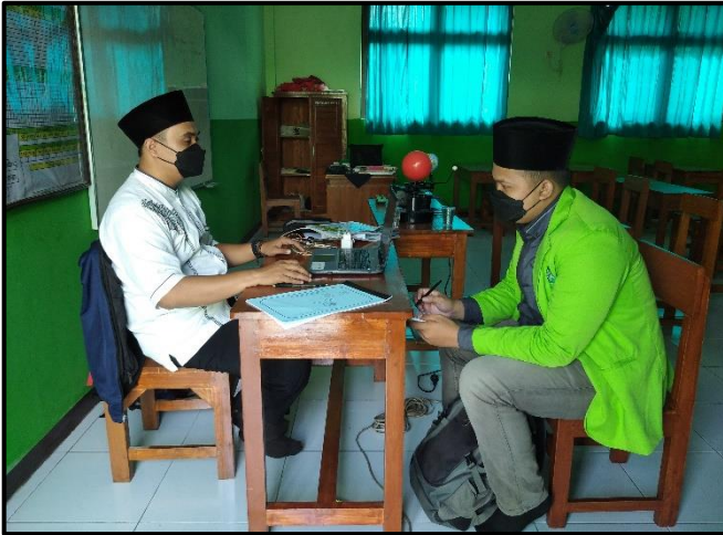
مقابلة مع معلم اللغة العربية للصف الرابع