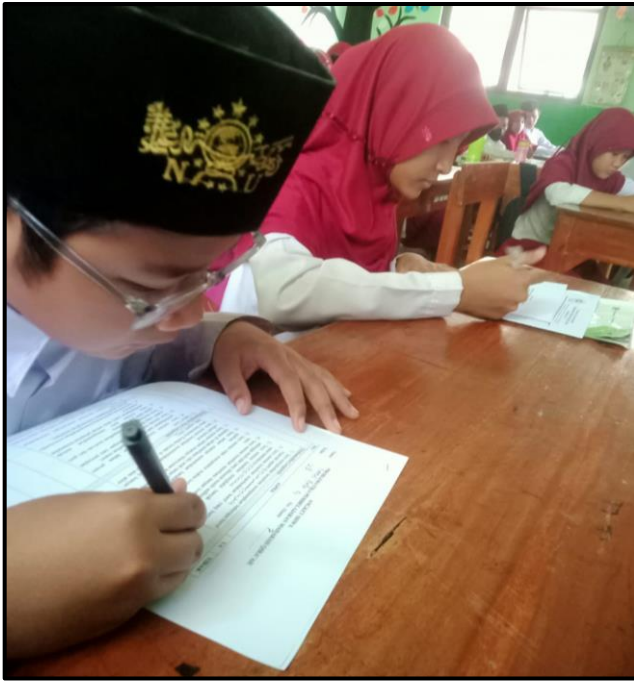
جمع بيانات استبيان التلاميذ