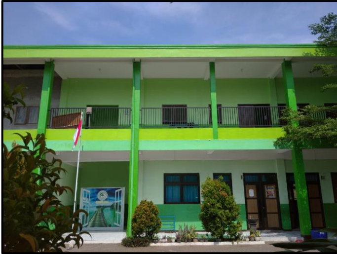
مدرسة بيت الهدى الابتدائية الإسلامية