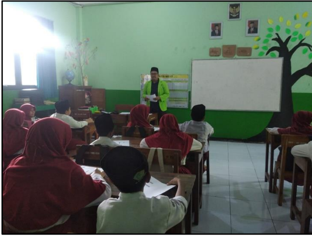
ملاحظة عملية تعليم مهارة القراءة في الفصل الرابع