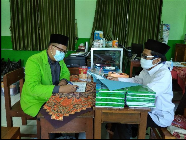
مقابلة مع رئيس المدرسة