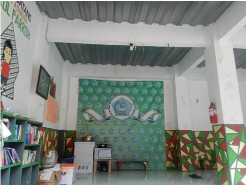
Gambar 4: Kantor Panti Asuhan Darul Farroh