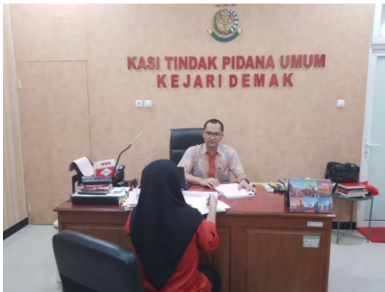
Foto Wawancara dengan Kasi Pidana Umum Kejaksaan Negeri Demak