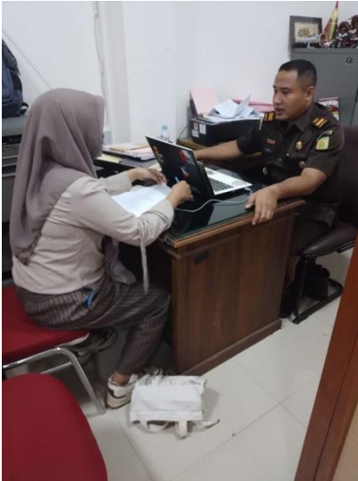
Foto Wawancara dengan Jaksa Penuntut Umum Kejaksaan Negeri Demak