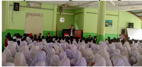
Gambar 4.4 dokumentasi keterlibatan aktif kepala sekolah dalam memberikan pembinaan agama kepada siswa-siswi

Dari pemaparan diatas dapat disimpulkan bahwa dengan demikian, kepala sekolah dan seluruh anggota sekolah di SMP Tahfidz Al-Mubarak berupaya mengintegrasikan nilai-nilai tabligh dalam aspek kehidupan di sekolah dengan kepala sekolah secara aktif memberikan pembinaan dan pengajaran agama kepada guru maupun siswa telah