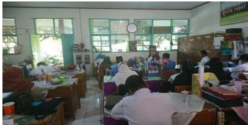
Dokumentasi briefing pagi kepala sekolah dengan guru