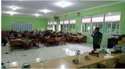
Gambar4.6: Dokumentasi kegiatan rapat evaluasi program kerja kepala sekolah

Pemaparan di atas diperkuat oleh observasi yang dilakukan peneliti bahwa adanya rapat evaluasi guru-guru dengan kepala sekolah di SMP Tahfidz Al-Mubarak. 98 Sebagaimana dokumentasi yang diperoleh peneliti sebagai berikut 99 :