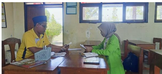
Wawancara dengan kepala sekolah