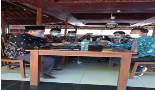
Dokumentasi kepala sekolah mengikuti pelatihan kepemimpinan