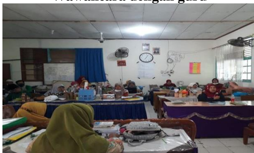
Dokumentasi rapat guru