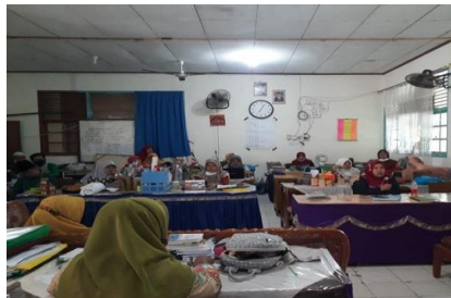
Gambar 4.1 Dokumentasi dalam rapat

rutin. Selain itu juga diakan rapat yang membahas tentang kejujuran dan kedisiplinan guru. Pertemuan atau diskusi rutin dapat menjadi wadah untuk membuka komunikasi antara kepala sekolah, dan guru. Ini menciptakan transparansi dalam menghadapi isu-isu penting, merencanakan program sekolah, dan pencapaian sekolah. Dengan komunikasi yang terbuka, kepala sekolah menunjukkan kejujuran dalam menghadapi tantangan dan memberikan solusi yang tepat. 84 Sebagaimana dokumentasi yang diperoleh peneliti sebagai berikut: 85