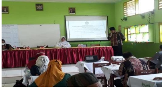
dokumentasi keterlibatan kepala sekolah dalam memberikan pengajaran dan pembinaan agama kepada guru