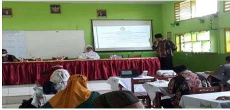
Gambar 4.3 dokumentasi keterlibatan kepala sekolah dalam memberikan pengajaran dan pembinaan agama kepada guru