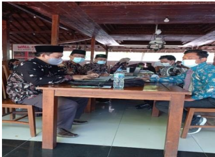
Gambar 4.9: Dokumentasi kegiatan mengikuti pelatihan kepemimpinan kepala sekolah

Kesimpulan dari paparan di atas adalah bahwa kepala sekolah SMP Tahfidz Al-Mubarak telah menerapkan sifat Fathonah Kegiatan mengikuti pelatihan kepemimpinan merupakan implementasi dari sifat Fathonah dalam kebijakan sekolah. Langkah ini menunjukkan