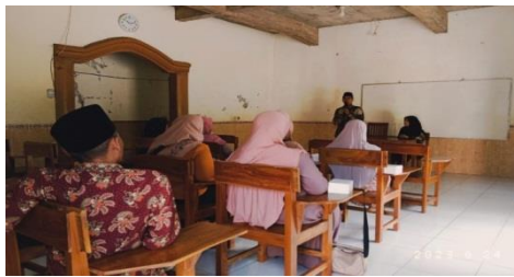
Gambar 4.8 Dokumentasi evaluasi pembelajaran bersama orang tua siswa

Pemaparan di atas diperkuat oleh observasi yang dilakukan peneliti bahwa rutin diakan rapat evaluasi tentang pelaksanaan program kerja kepala sekolah yang menunjukkan bahwa kepala sekolah amanah dalam menjalankan tugasnya.. 103 Sebagaimana dokumentasi yang diperoleh peneliti sebagai berikut: 104