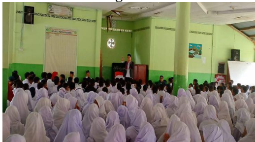
dokumentasi keterlibatan aktif kepala sekolah dalam memberikan pembinaan agama kepada siswa-siswi