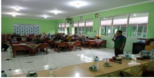
Dokumentasi rapat evaluasi pelaksanaan program kerja