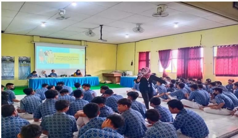
Gambar 4: Projek Bangunlah Jiwa dan Raganya (Seminar kenakalan remaja)