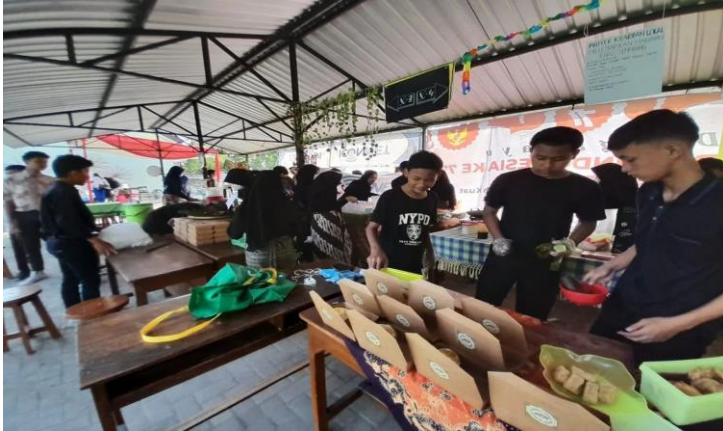
Gambar 1: Projek Kearifan lokal (makanan khas daerah)