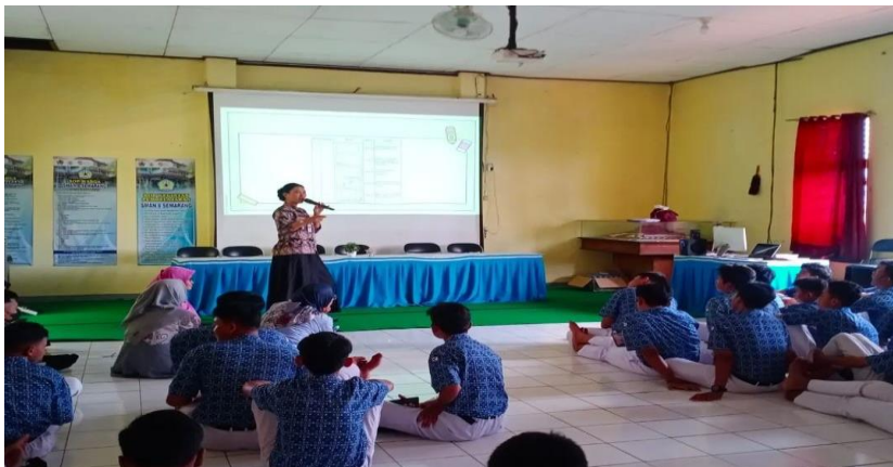
Gambar 5: Projek Bangunlah Jiwa dan Raganya (Seminar pembuatan film pendek)