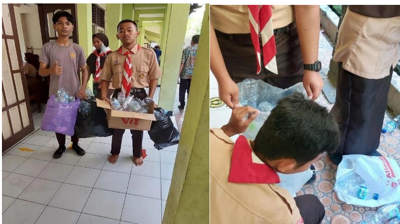
Gambar 6: Projek Gaya Hidup Berkelanjutan (Pemanfaatan barang bekas)