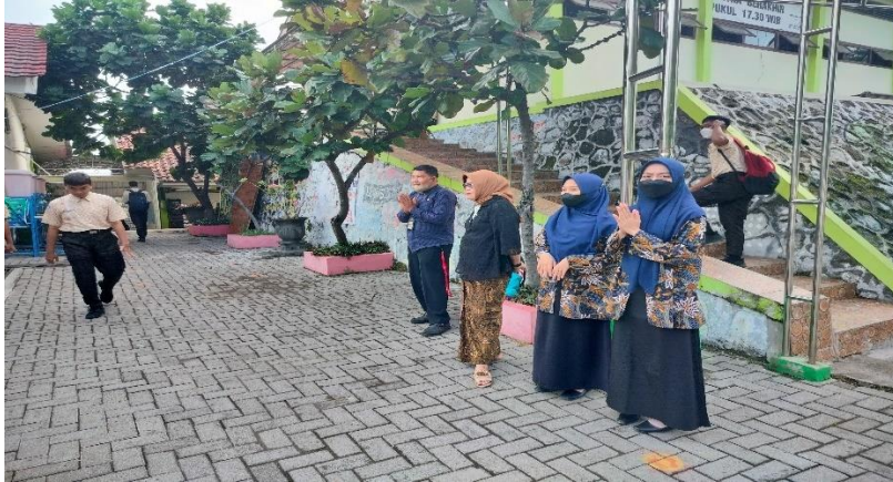
Gambar 8: penyambutan siswa melalui 5s (senyum, salam, sapa, sopan, santun)