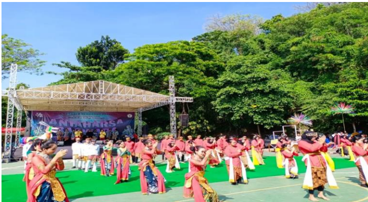
Gambar 2: Projek Kearifan lokal (Tarian khas daerah)