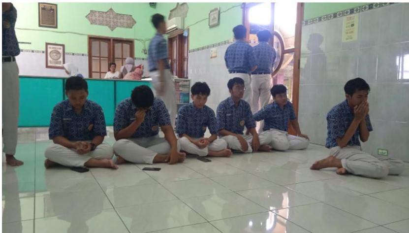
Gambar 13: Kegiatan Sholat Berjamaah