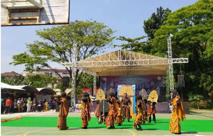
Gambar 3: Projek Kearifan lokal (Drama kolosal khas daerah)