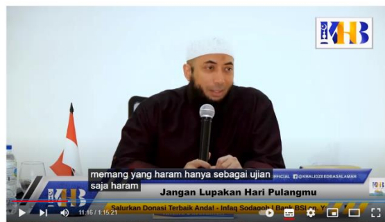
Kajian Tematik: Jangan Lupakan Hari Pulangmu - Khalid Basalamah