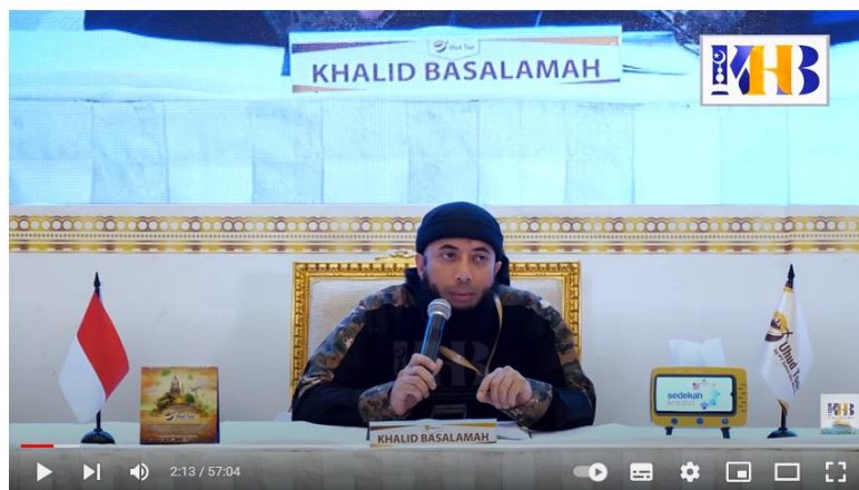
Gambar 3. 6 Tampilan Video

Kajian Tematik: Indahnya Berbagi - Khalid Basalamah