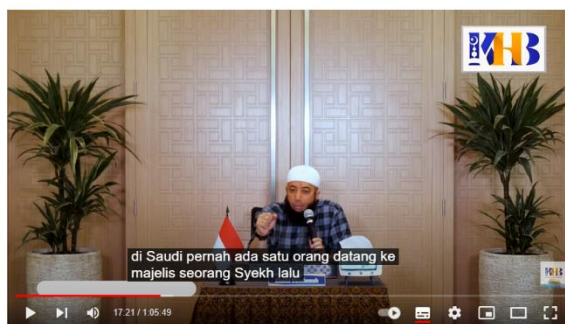
Gambar 3. 22 ustadz Khalid Basalamah menceritakan tentang seorang syekh

Kajian Tematik: Mukmin Antara Syukur dan Sabar - Khalid Basalamah