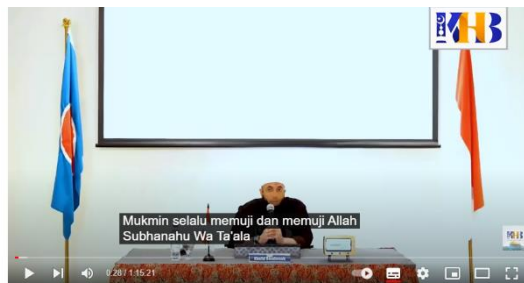
Gambar 3. 13 selalu mendoakan kebaikan untuk mad’unya

Kajian Tematik: Jangan Lupakan Hari Pulangmu - Khalid Basalamah