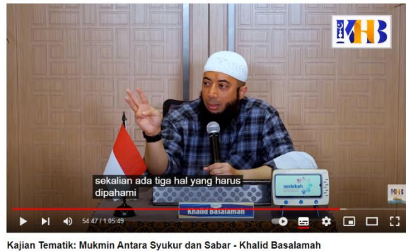
Gambar 3. 23 ustadz Khalid Basalamah menyampaikan ada tiga hal yang harus pahami