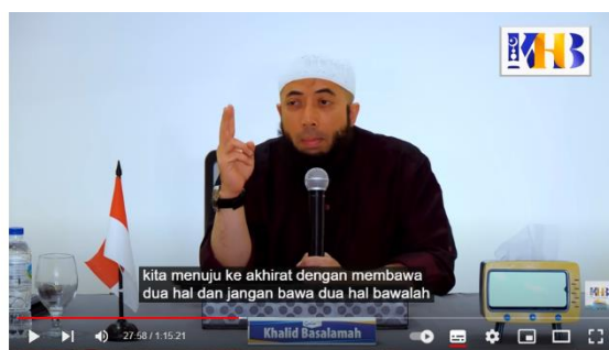
Gambar 3. 16 menuju ke akhirat dengan membawa dua hal dan meniggalkan dua hal

Kajian Tematik: Jangan Lupakan Hari Pulangmu - Khalid Basalamah