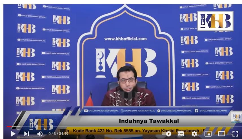
Gambar 3. 4 Tampilan Video

Kajian Tematik: Indahnya Tawakkal - Khalid Basalamah