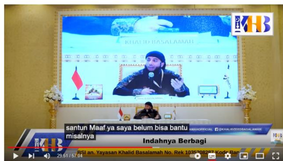
Gambar 3. 19 ustadz Khalid Basalamah menjelaskan surat Al-Baqoroh ayat 263

Kajian Tematik: Indahnya Berbagi - Khalid Basalamah