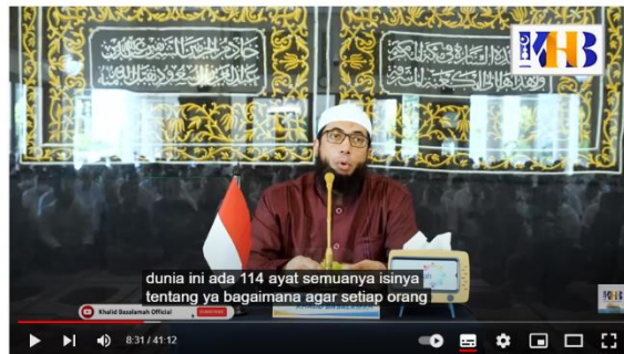
Gambar 3. 9 ustadz Khalid Basalamah menyampaikan tentang dunia

Kajian Tematik: Maksimalkan Dunia Ini Dengan Hal yang Baik - Khalid Basalamah