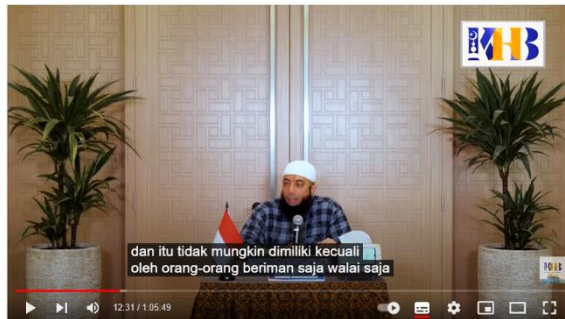
Gambar 3. 21 Ustadz Khalid Basalamah menyampaikan sebuah Hadis riwayat Imam Muslim

Kajian Tematik: Mukmin Antara Syukur dan Sabar - Khalid Basalamah