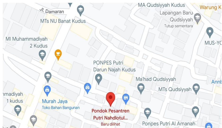
Peta Pondok Pesantren Al-Mubarakah Damaran Kudus