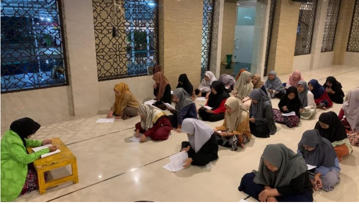
الملاحق ١٤ : صورة