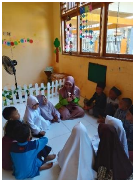
Gambar 2 Guru Bercerita Menggunakan Boneka Jari