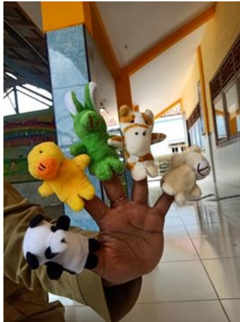
Gambar 5 Desain Boneka Jari

Media yang digunakan dalam penelitian ini adalah boneka jari yang terbuat dari kain flanel yang sederhana dan menarik yang dapat membangkitkan minat anak-anak.