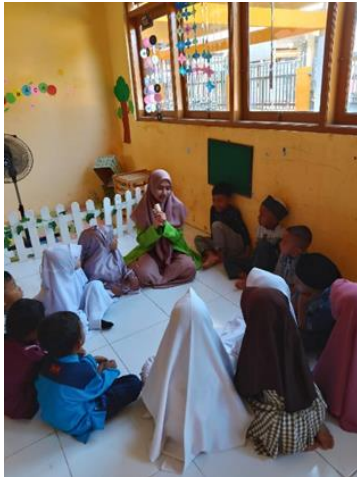
Gambar 3 Guru bercerita menggunakan boneka jari

A, Penerapan metode bercerita boneka jari ini dilakukan selama