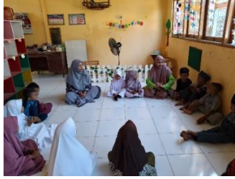
Gambar 3 Guru Melakukan Sesi Tanya-Jawab dengan Anak-Anak