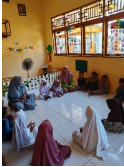
Gambar 1 Guru Membimbing Murid Berdo'a Bersama