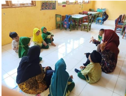
Gambar 4 guru melakukan recalling

“awalnya bertanya kabar dulu dan guru menerangkan dan memberikan apresiasi agar anak fokus pada tema hari ini, setelah itu akan timbul pertanyaan-pertanyaan atau tanya jawab yang akan mengacu pada tema hari ini” , tambah bu iim.