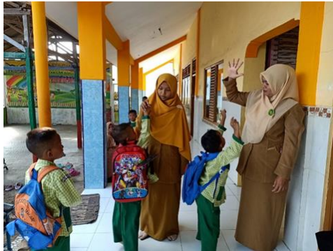
Gambar 2 anak-anak sebelum memasuki kelas

melakukan kegiatan membaca doa-doa harian, dan surat-surat pendek. Sebelum masuk kedalam kelas masing-masing setiap anak akan diberikan pilihan untuk tos dengan lima jari, tos dengan jempol atau tos dengan kaki. Setelah itu anak-anak masuk kedalam ruang kelas untuk melakukan pembukaan, seperti biasa guru menanyakan kabar anak dan juga membahas sekilas materi yang akan dipelajari pada hari itu juga.