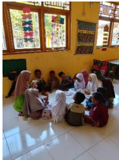
Gambar 4 Recalling