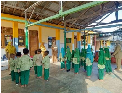
Gambar 1 anak-anak baris-berbaris sebelum kegiatan pembelajaran

pada saat kegiatan inti sesuai dengan RPPH yang sudah dibuat. Pelaksanaan pembelajaran kelompok A di TK Aisyiyah Bustanul Athfal berlangsung selama 180 menit dengan rincian permainan selama 30 menit, pembukaan selama 30 menit, kegiatan pembelajaran 90 menit dan kegiatan penutup selama 30 menit. Proses pembelajaran pada kelompok A TK Aisyiyah Bustanul Athfal Kluwut dimulai dengan penyambutan (Menyambut kedatangan anak ke sekolah dengan cara semua guru berbaris di depan kelas).