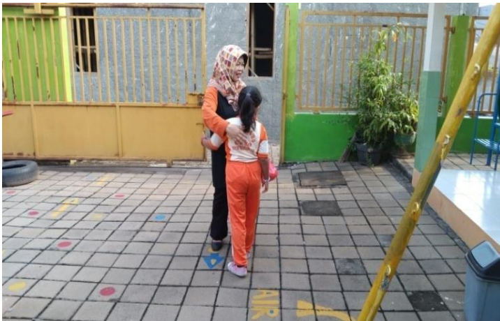
Penyambutan saat guru datang dengan menunjukkan pembiasaan budaya 5S(Senyum, Salam, Sapa, Sopan, Santun)