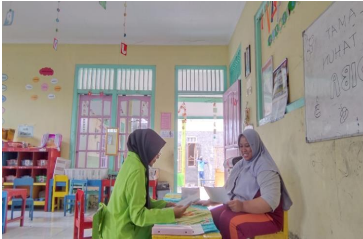
Wawancara dengan guru kelas TK A