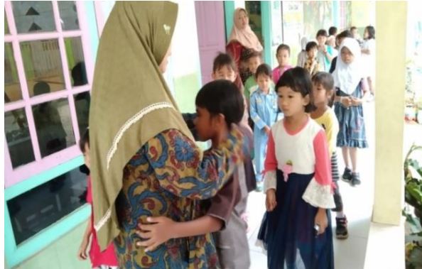
Gambar 4.3 Gambar penerapan pembiasaan (Sumber :Dokumen Pribadi)

Pembiasaan merupakan sebuah metode dalam pendidikan berupa “proses penanaman kebiasaan”. 59 Pembiasaan yang baik penting artinya bagi pembentukan karakter anak-anak, dan juga akan terus berpengaruh kepada anak itu sampai hari tuanya. 60