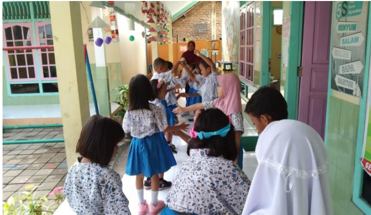
Melaksanakan tepuk 5S Sebagai wujud pembiasaan budaya 5S (Senyum, Salam,Sapa, Sopan, Santun) Di TK PGRI 04/89 Ngaliyan