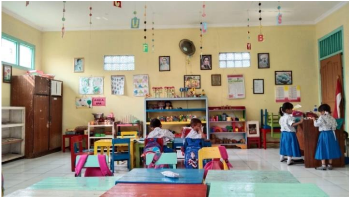
Gambar 4.6 Gambar anak yang sosial emosionalnya kurang

malu yang berlebih karena faktor dari keluarganya yang selalu membentak anak saat dirumah. Sehingga anak Hasil observasi dan wawancara diatas didukung dengan dokumentasi sebagai berikut :