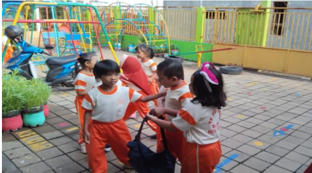
Gambar 4.4 Gambar anak melakukan interaksi