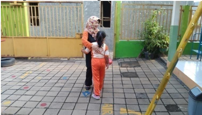
Gambar 4.1 Gambar penyambutan dengan salah satu pembiasaan 5S yaitu sapa

Hasil observasi dan wawancara diatas didukung dengan dokumentasi sebagai berikut :