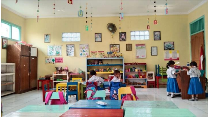
Anak yang sosial emosional kurang baik anak tersebut diam saja saat di Kelas Di TK PGRI 04/89 Ngaliyan