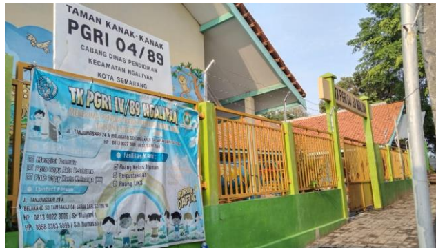
Bagian depan lembaga TK PGRI 04/89 Ngalayan