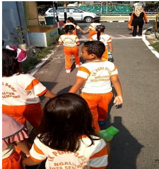
Gambar 4.5 Gambar strategi atau upaya