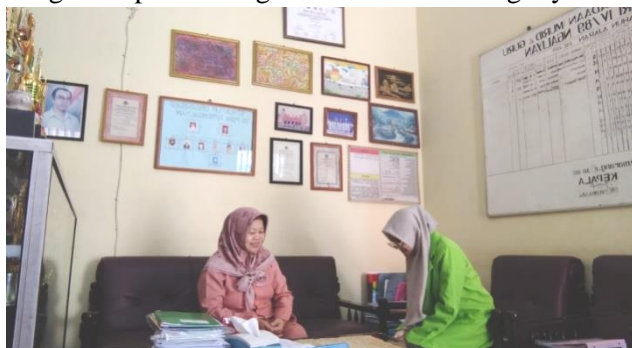
Wawancara dengan kepala sekolah