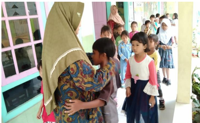
Penerapan pembiasaan budaya 5S berupa(Senyum, Salam, Sapa, Sopan, Santun)saat sedang berbaris sebelum masuk ke dalam kelas Di TK PGRI 04/89 Ngaliyan