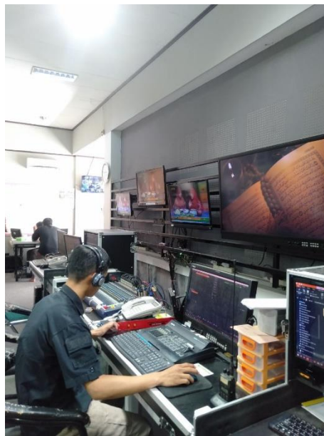
Gambar 9. Ruang belakang layar di MTA TV