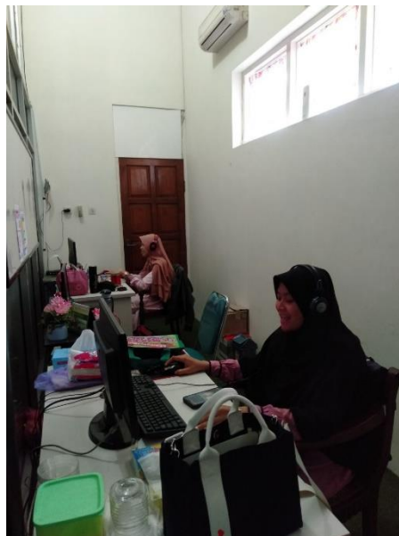
Gambar 7. Ruangan editor dan pembuat naskah putri di MTA TV