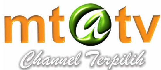
Gambar 1. Logo MTA TV