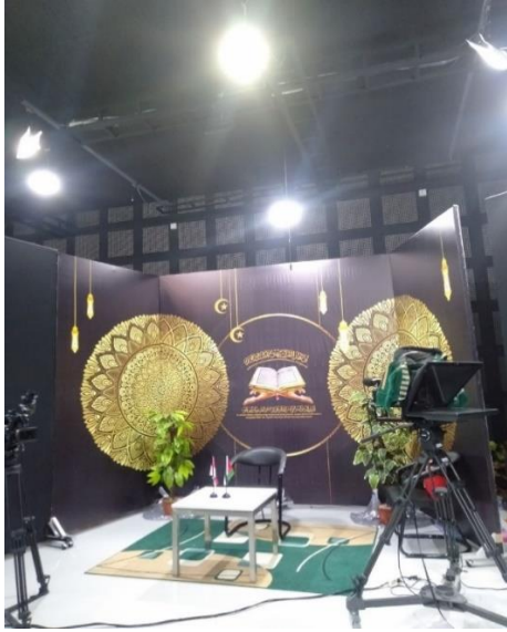
Gambar 10. Studio Siaran MTA TV