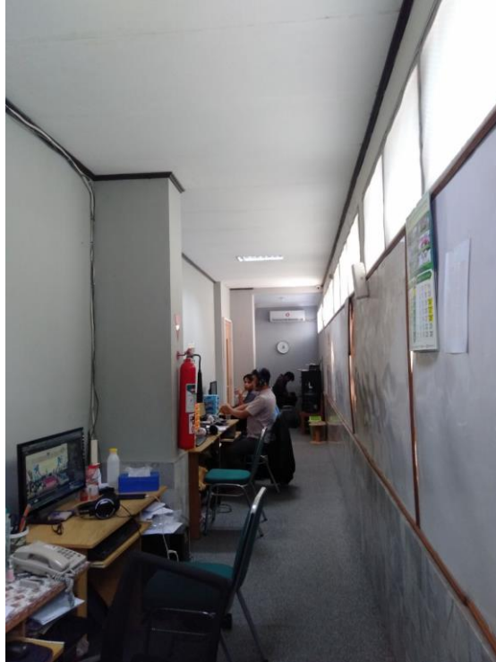
Gambar 8. Ruang editor putra di MTA TV