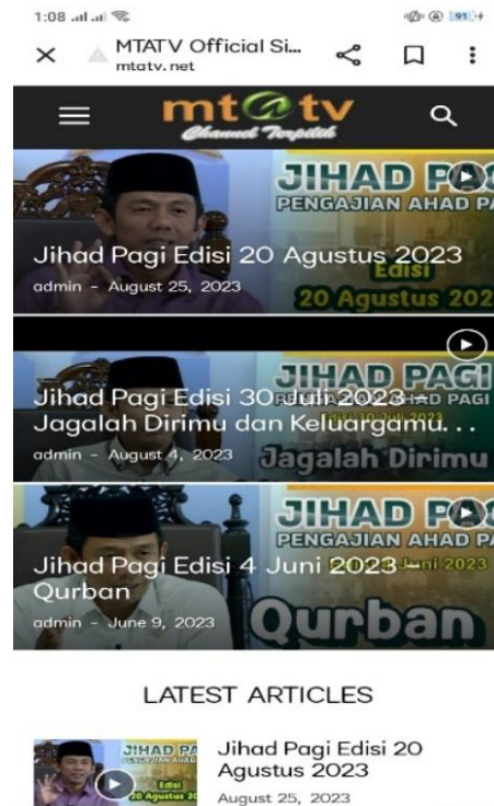
Gambar 2. Website Streaming MTA TV