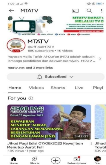
Gambar 3. Youtube MTA TV