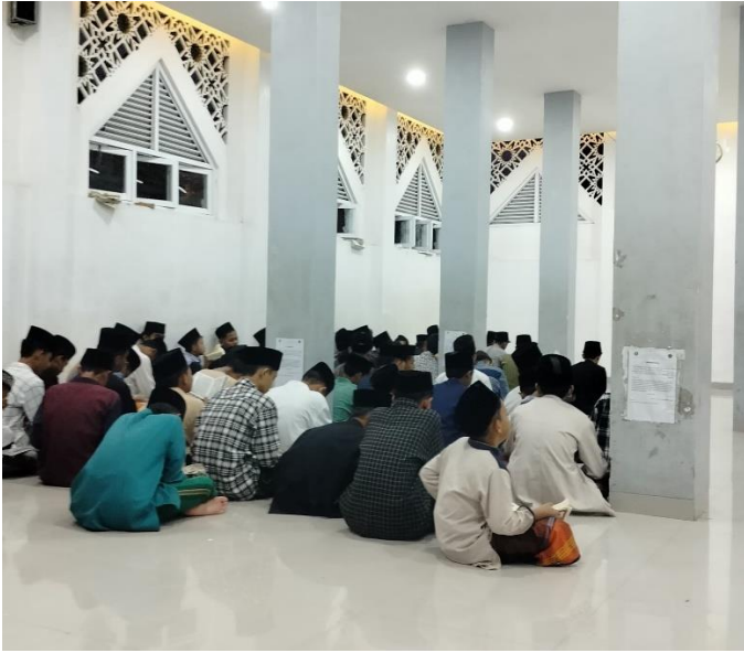
(Kegiatan Takallum ba'da sholat)