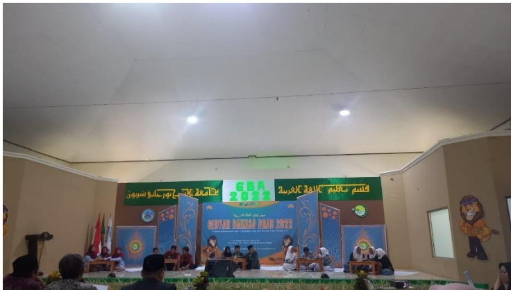
(Partisipasi santri dalam lomba Bahasa Arab)