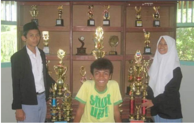
(Prestasi santri dalam lomba debat Bahasa Arab tingkat madrasah 'alimah )