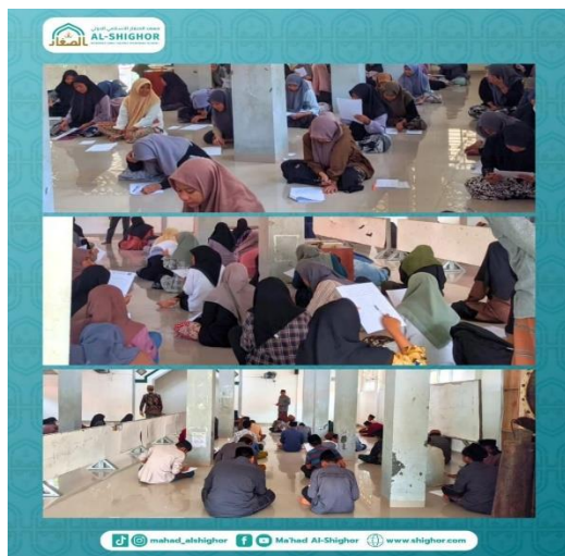
(Ujian intensif Bahasa Arab)