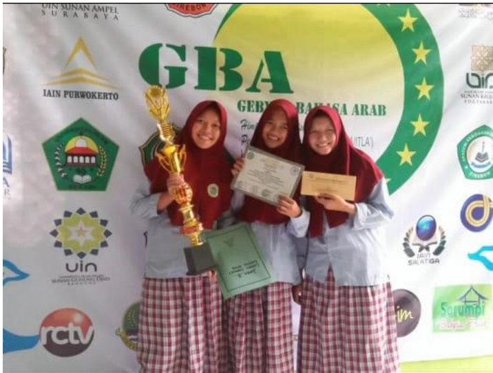
(Prestasi santri dalam lomba cerdas cermat Bahasa Arab pada event gebyar Bahasa Arab di IAIN Syekh Nurjati Cirebon)