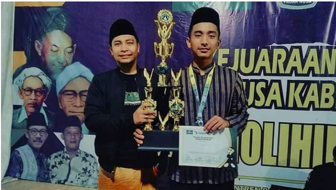
(Prestasi santri dalam lomba pidato Bahasa Arab)