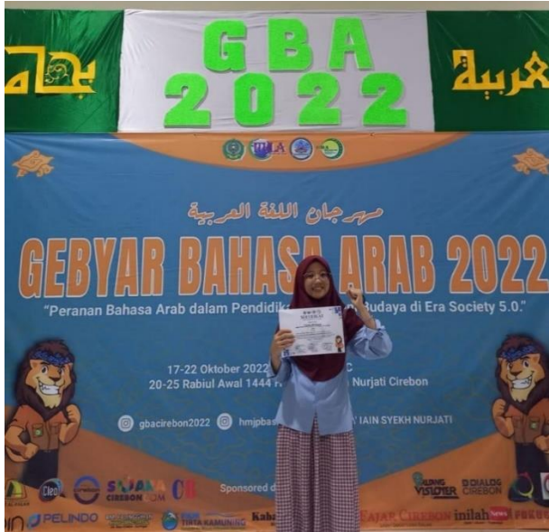
(Partisipasi santri pada event gebyar Bahasa Arab di IAIN Syekh Nurjati Cirebon)