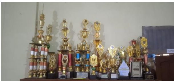
(Piala Prestasi para santri)