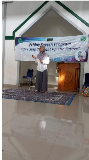
(Kegiatan Khitobah setiap jum'at)