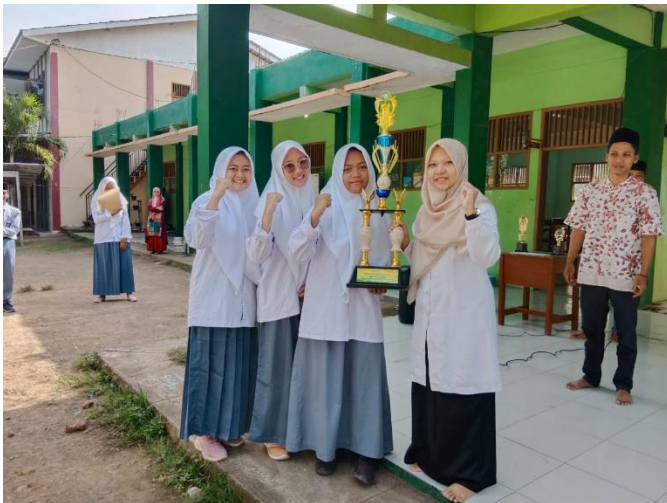
(Prestasi santri dalam lomba Bahasa Arab)