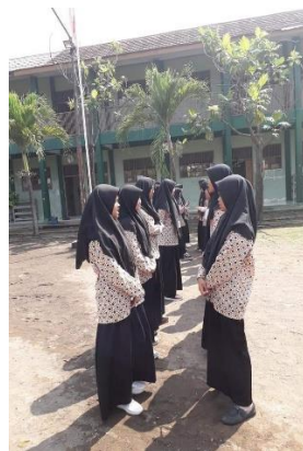
(Kegiatan Muhadatsah pagi hari)