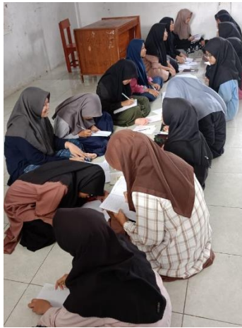
(Kegiatan Muhadatsah dalam kelas)