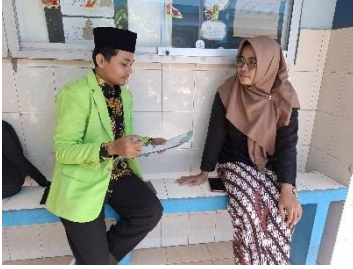
المقابلة مع رئيسة المدرسة