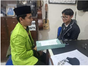
المقابلة مع الطالب