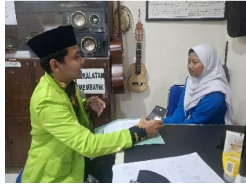
المقابلة مع الطالبة