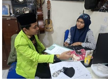
المقابلة مع المعلمة