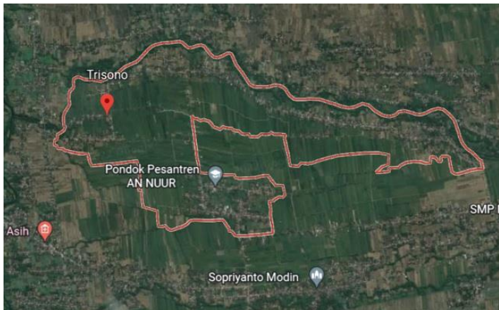
Gambar 7. Peta Desa Trisono