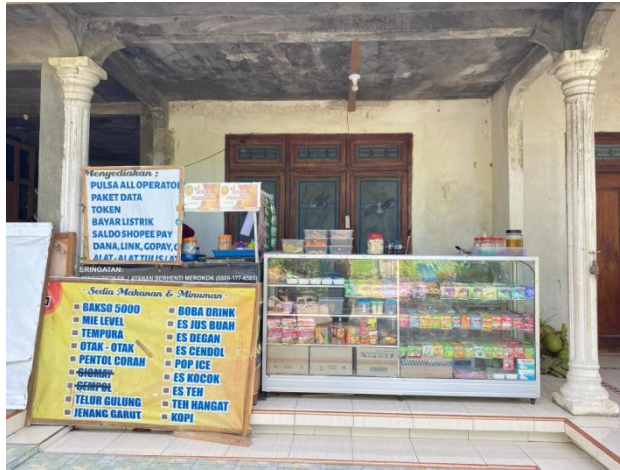
Gambar 8. Gerai Asri Cell