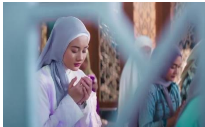
Gambar 4.1 Scene berdoa (menit 8.23)