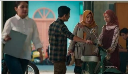
Gambar 4.7 Scene dialog tolong menolong (menit 00.33.56)

Karyawan Dodi : “Oh ini mas, motor kakaknya rusak, minta dibenerin disini”