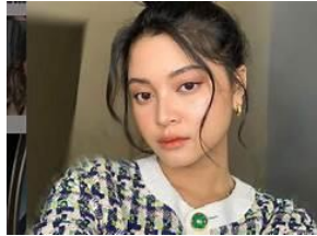
Gambar 3.11 Tokoh Mira

Yoriko Angeline adalah seorang aktris, model, penyanyi, dan pembawa acara asal Indonesia. Yoriko Angeline memerankan tokoh Mira, mantan pacar Angga. Mira dan Angga berpacaran sudah cukup lama hingga akhirnya mereka putus karena Mira telah dijodohkan oleh orang tuanya dengan lelaki yang tentunya lebih dari Angga.