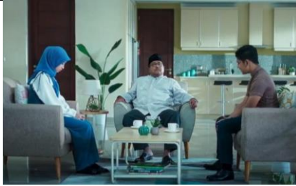
Gambar 4.8 scene Kejujuran Dodi atas syarat yang diberikan Ayah Aghnia (menit 01.25.59)

Ayah Aghnia : “Kenapa nggak kamu tinggal saja? Kamu kan sedang menjalankan syarat dari saya!”