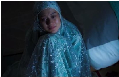
Gambar 4.2 Scene Memohon Ampunan (menit 1.21.09)

Visualisasi tokoh Ratih sedang mendekatkan diri kepada Allah dengan cara shalat taubat dan memohon ampun dan berdoa kepada Allah dengan mengangkat kedua tangannya dan menangis karena menyesal karena telah melanggar aturan agama yaitu berpacaran.