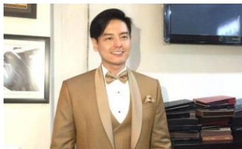
Gambar 3.5 Tokoh Arya