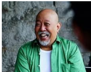
Gambar 3.12 Tokoh Rofiq

Indro Warkop memiliki nama asli Indrojojo Kusumanegoro, merupakan aktor senior yang sangat