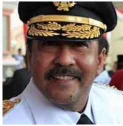
Gambar 3.15 Tokoh Ayah Aghnia

Rano Karno merupakan seorang aktor, politikus, dan sutradara yang tidak diragukan lagi aktingnya. Dalam film ini Rano Karno memerankan sebagai ayah Aghnia. Disini ayah Aghnia memiliki syarat untuk Dodi, bila ingin menikahi anaknya harus shalat subuh 40 hari tanpa putus di Masjid.