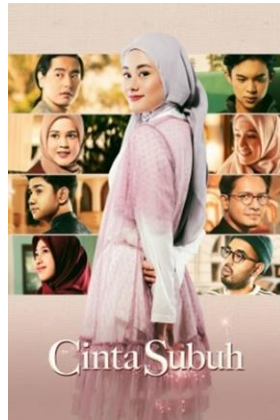
Gambar 3.1 Profil Film Cinta Subuh

Film Cinta Subuh merupakan karya dari sutradara Indra Gunawan. Film ini diadopsi dari novel yang berjudul Cinta Subuh karya Ali Farigi. Film ini berada dalam naungan Falcon Pictures. Produser Falcon Pictures mengatakan pihaknya tertarik menggarap Cinta Subuh karena ceritanya yang menyebarkan nilai-nilai positif. Film ini dijadwalkan tayang di bioskop-bioskop Indonesia pada hari Kamis, 19 Mei 2022. Dua Negara yang menjadi penayangan film ini yaitu Indonesia dan Malaysia. Rating yang diperoleh film ini 8,2/10 dan jumlah penonton yang diperoleh saat penayangan di