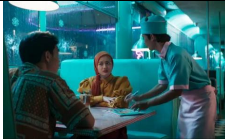
Gambar 4.4 Scene dilarang bersentuhan kepada yang bukan mahram (menit 00.25.07)