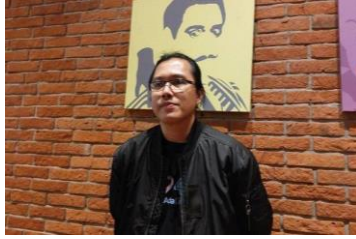
Gambar 3.2 Sutradara Indra Gunawan

Indra Gunawan adalah seorang sutradara film Indonesia yang dikenal lewat karyanya dalam drama romantis Cinta Subuh (2022). Ia mengawali kariernya di industri film Indonesia dengan berbagai peran, termasuk sebagai asisten sutradara dan penulis naskah, sebelum akhirnya menduduki kursi sutradara. Indra Gunawan memulai kariernya mulai tahun 2007 sebagai asisten sutradara film Get Merried . Debutnya sebagai sutradara dimulai dalam film Hijrah Cinta pada tahun 2014. Selama berkarir sebagai sutradara, ia sering menyutradarai film yang diadaptasi dari novel, diantaranya,