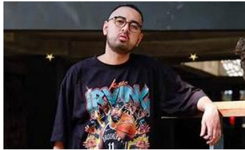
Gambar 3.8 Tokoh Ghani

Kemal Palevi berperan sebagai Ghani salah satu teman Angga yang selalu memberikan solusi ketika Angga dalam kesusahan apalagi kalau berurusan dengan wanita. Seperti pada saat angga dengan Mira baru saja putus, Ghani mengajak Angga untuk salat ke Masjid agar tidak galau-galauan terus. Ghani selalu memberikan nasihat soal agama dan kehidupan kepada Angga, serta selalu sabar menghadapi sikap buruk Angga.