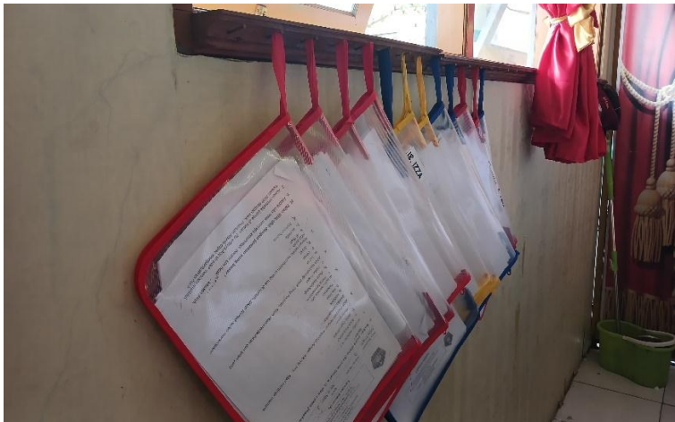
Portofolio peserta didik