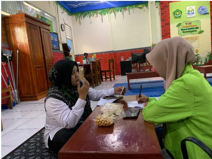
Wawancara dengan Wali kelas II C