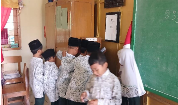
Peserta didik mengambil buku bacaan di pojok baca