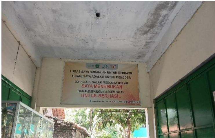
Lingkungan akan kaya teks