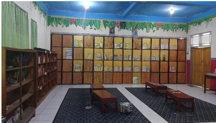
Perpustakaan MIN 1 Kendal