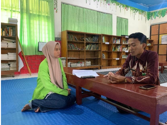
Wawancara dengan Petugas Perpustakaan