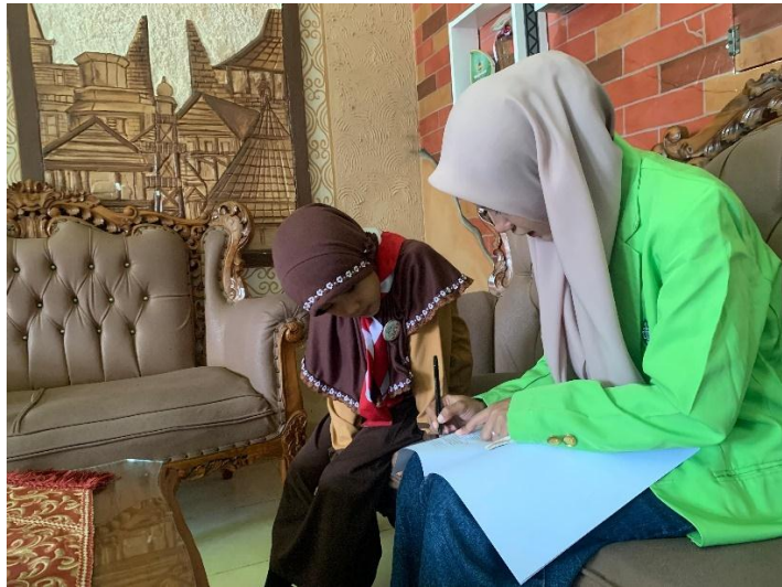
Wawancara dengan Siswi Kelas II