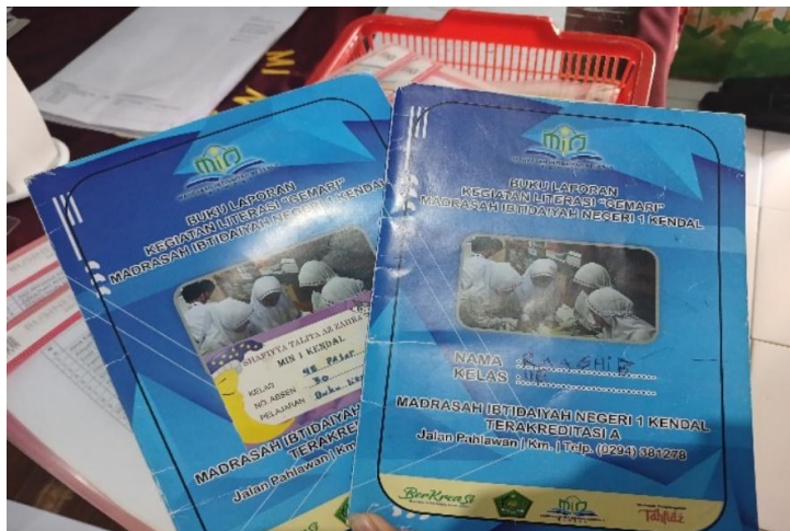
Buku Laporan GEMARI