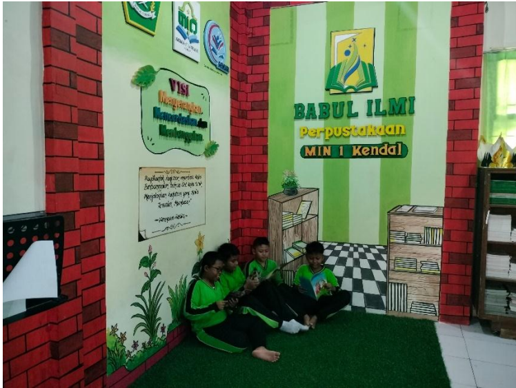
Peserta didik membaca dan mendiskusikan buku bacaan