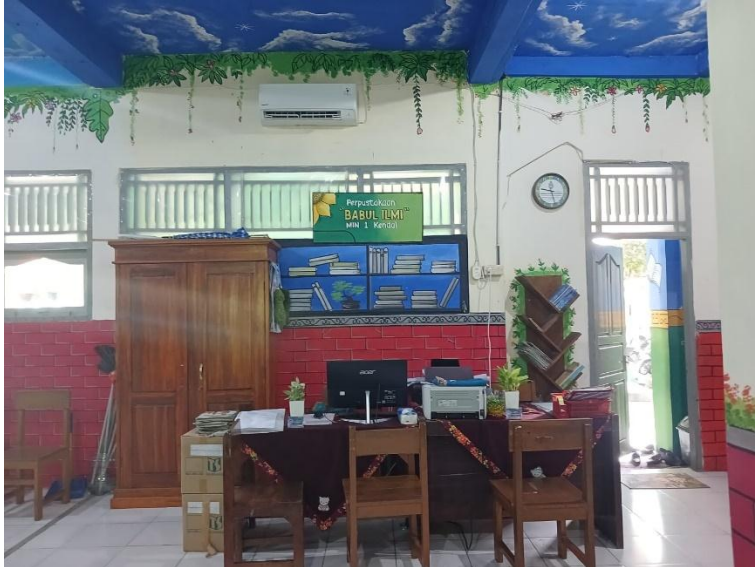
Tempat konfirmasi peminjaman buku bacaan diperpustakaan