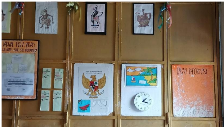
Ruang kelas yang penuh literasi