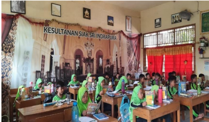
Kegiatan Program GEMARI