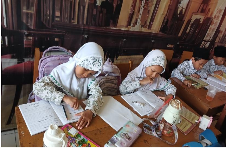
Peserta didik menulis yang telah dibaca di buku laporan