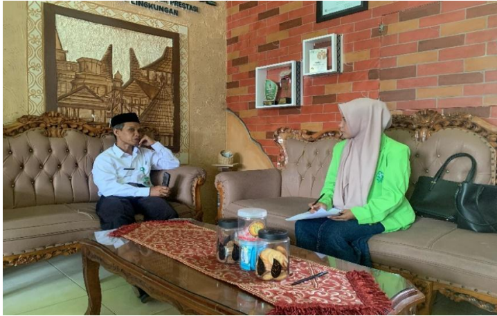
Wawancara dengan kepala madrasah