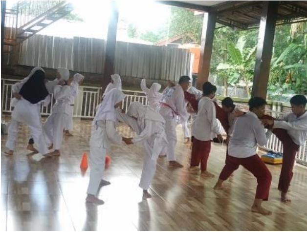
Ekstrakurikuler Pencak Silat