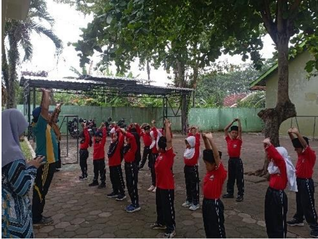
Ujian Praktik Olahraga