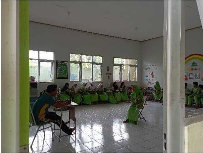
Ujian Praktik Bahasa Jawa