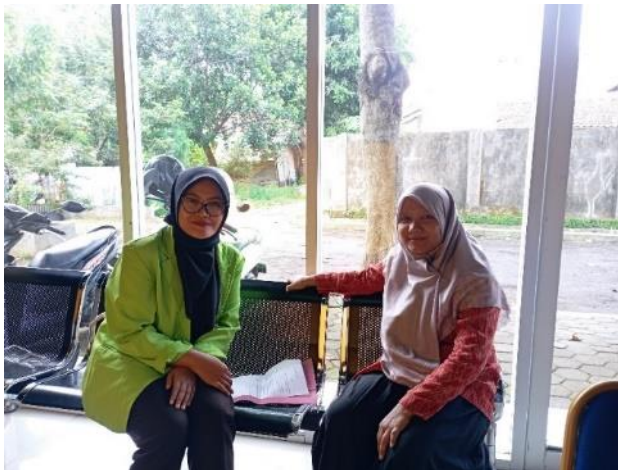
Wawancara dengan Guru Kelas 3