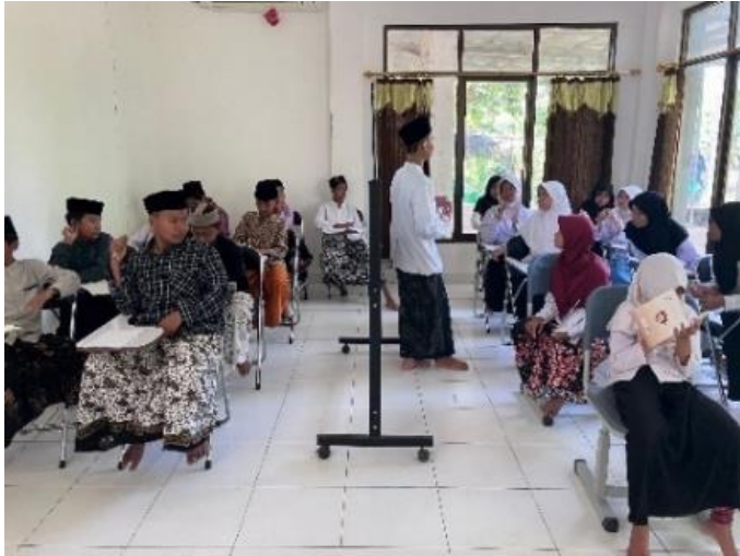
Gambar 4.4 Kegiatan Menginap di Pondok Pesantren

Kegiatan outbound untuk kelas 1, 2, dan 3, masing-masing kelas memiliki standar tantangan masing-masing disesuaikan dengan umur mereka. Kegiatan kunjungan tematik untuk kelas 1, 2, dan 3, materinya disesuaikan dengan tema masing-masing kelas. Kegiatan menginap di rumah teman untuk kelas 4, kegiatan ini untuk melatih siswa menjadi tamu dan tuan rumah yang baik, kegiatannya seperti melaksanakan sholat berjamaah bersama, membaca al-Qur'an bersama, makan bersama, belajar bersama, membantu orang tua bersama, dan penilaiannya terdapat guru yang monitoring setiap setelah maghrib dan juga dibantu orang tua untuk menilai kegiatan yang dilakukan