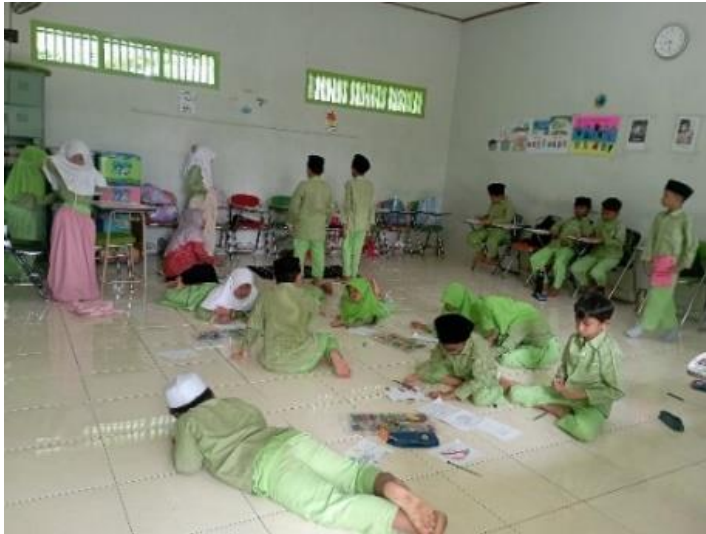
Ujian Praktik Seni Menggambar