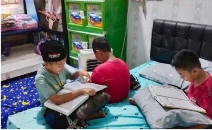
Gambar 4.3. Kegiatan Menginap di Rumah Teman