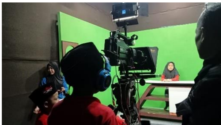
Gambar 4.2. Kegiatan Kunjungan Tematik