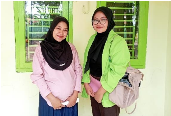
Wawancara dengan Guru Kelas 5