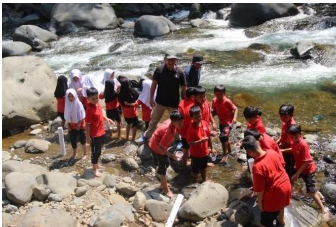
Gambar 4.1. Kegiatan Outbound

Berikut adalah gambar program semester di Sekolah Dasar Islam Terpadu Bahrul Ulum: