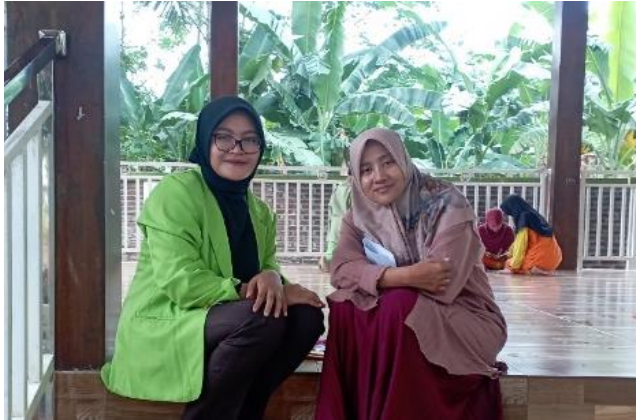
Wawancara dengan Guru Kelas 4