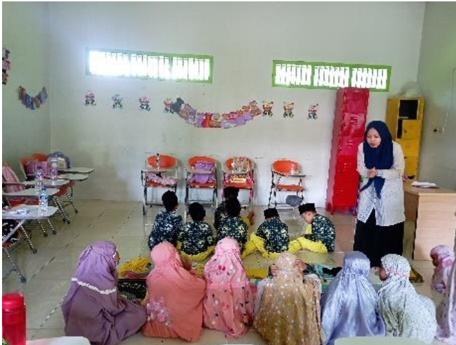
Kegiatan Sholat Dhuha Berjamaah