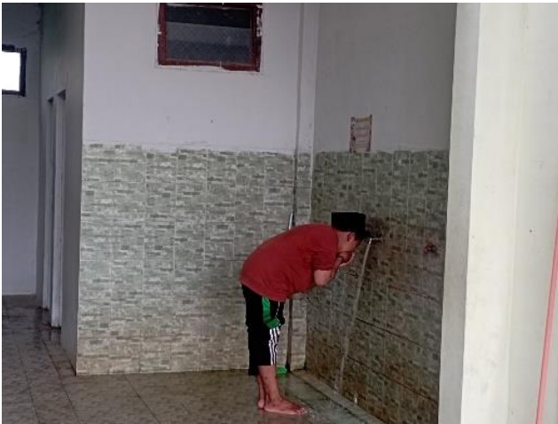
Ujian Praktik Ibadah