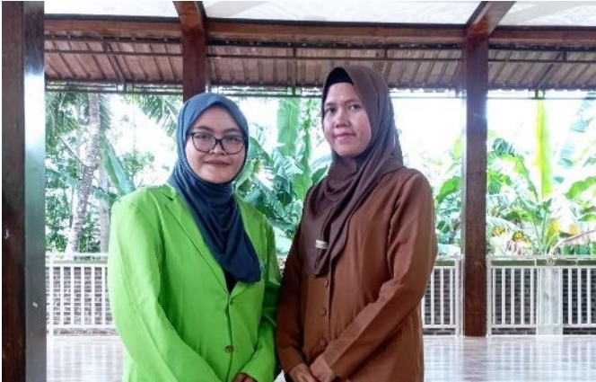
Wawancara dengan Guru Kelas 6