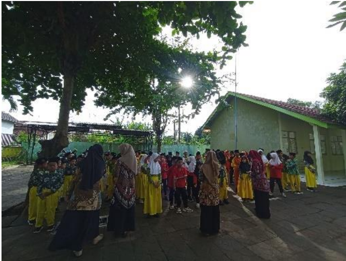
Kegiatan Do'a Pagi Bersama