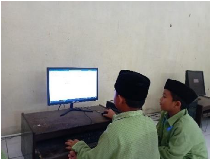
Ujian Praktik TIK