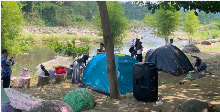
Gambar 4.5. Kegiatan supercamp