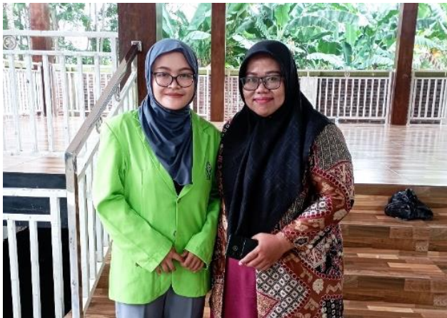
Wawancara dengan Guru Mapel Bahasa Inggris