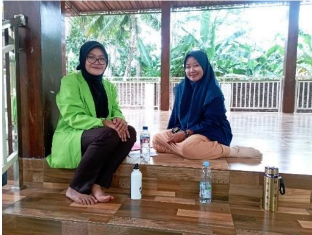
Wawancara dengan Guru Kelas 2