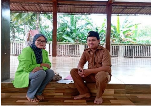
Wawancara dengan waka kesiswaan