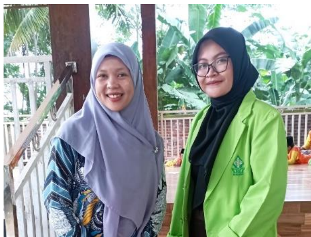
Wawancara dengan Guru Kelas 1