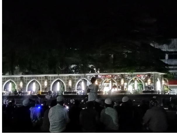
Gambar 6 Maulid Syaroful Anam