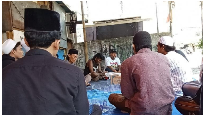
Gambar 4 Kegiatan Bershalawat Di Basecamp Komunitas Punk