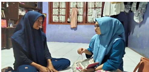
Dokumentasi wawancara dengan NE