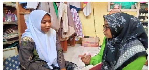
Dokumentasi wawancara dengan RH teman NE