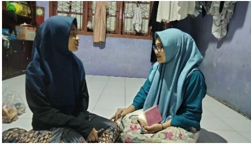
Dokumentasi wawancara dengan DM