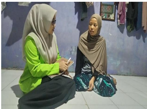
Dokumentasi wawancara dengan AT