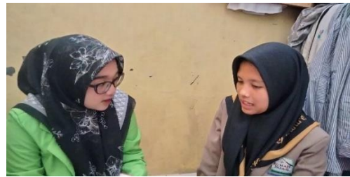
Dokumentasi wawancara dengan NF teman SN