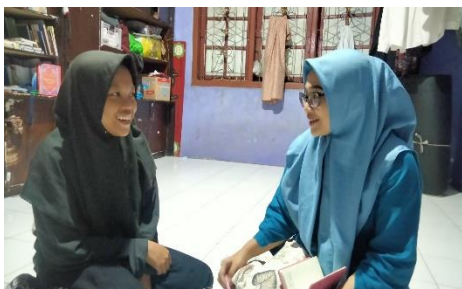
Dokumentasi wawancara dengan FA