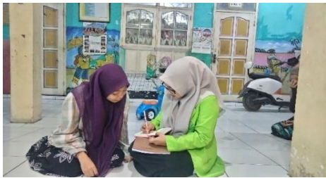
Dokumentasi wawancara dengan SN