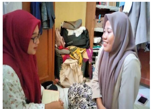
Dokumentasi wawancara dengan DL teman AT