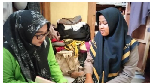
Dokumentasi wawancara dengan FMA teman FA