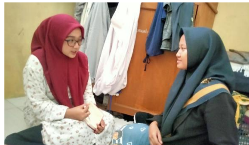
Dokumentasi wawancara dengan WH teman SNH