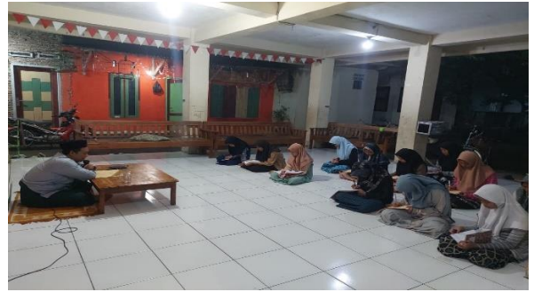
Dokumentasi kegiatan Bimbingan Agama