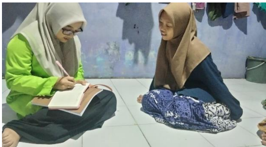
Dokumentasi wawancara dengan SNH