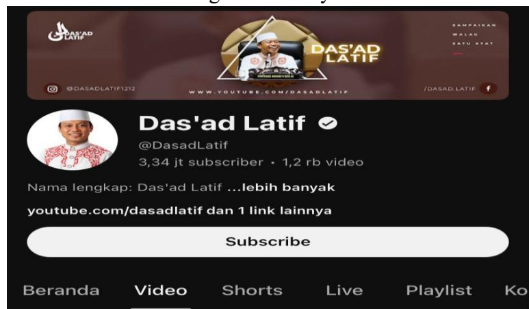
Gambar 3. Channel YouTube Das'ad Latif