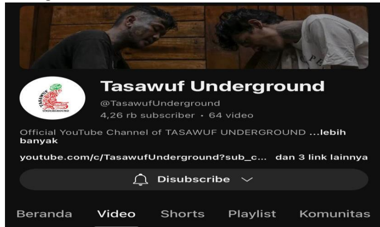
Gambar 5. Channel YouTube Tasawuf Underground

Ustaz Halim Ambiya dikenal dengan dakwahnya yang menyentuh hati dan dekat dengan berbagai kalangan, termasuk anak muda. Salah satu konten dakwahnya yang menarik perhatian adalah interaksinya dengan anak-anak punk di Youtube. Ustaz Halim Ambiya sering mengadakan kajian dan pengajian khusus untuk anak-anak punk . Dalam konten ini, beliau membahas berbagai tema Islam dengan cara yang mudah dipahami dan relevan dengan kehidupan mereka, beliau juga mengajak anak-anak punk untuk bisa mengaji Al-Quran dan mempelajari ilmu agama Islam. Konten dakwah Ustaz Halim Ambiya dengan anak punk di Youtube adalah bukti bahwa Islam dapat diterima oleh semua kalangan dan dapat menjadi solusi untuk berbagai permasalahan dalam kehidupan. Beliau banyak memberikan kontribusi yang besar dalam menyebarkan dakwah Islam dan membantu anak-anak punk untuk menemukan jalan hidup yang lebih baik.