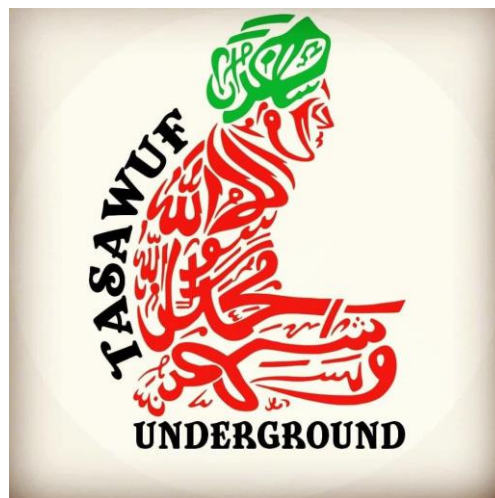
Gambar 7. Logo Tasawuf Underground