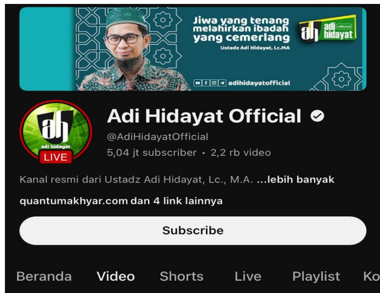
Gambar 1. Channel YouTube Adi Hidayat Official

Konten dakwah Ustaz Adi Hidayat di Youtube dikemas dengan cara yang menarik dan mudah dipahami, sehingga bisa dinikmati oleh semua kalangan. Cara penyampaian dakwahnya dengan penuh semangat dan antusiasme, sehingga dapat memotivasi para pendengarnya untuk menjadi Muslim yang lebih baik.