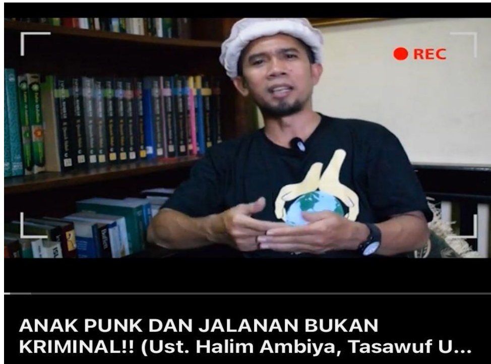
Gambar 9. Konten YouTube Ustaz Halim Ambiya "Anak Punk dan Jalanan Bukan Kriminal"

Dalam konten tersebut Ustaz Halim Ambiya menjelaskan bahwasanya anak punk dan jalanan bukan kriminal, akan tetapi yang memicu kriminalitas adalah masyarakat yang memandang anak jalanan sebagai orang jahat. Ustaz Halim Ambiya menyampaikan keluhan kesah yang dirasakan oleh anak-anak jalanan yaitu mereka sering kali di pandang hina dan di anggap sebagai sampah masyarakat hanya karena penampilan mereka yang bertato dan mengamen di jalanan, sehingga mereka merasa tidak pantas untuk mendatangi pengajian maupun tempat ibadah. Ustaz Halim Ambiya dalam vidio tersebut mengajak masyarakat untuk merangkul dan peduli terhadap anak jalanan.