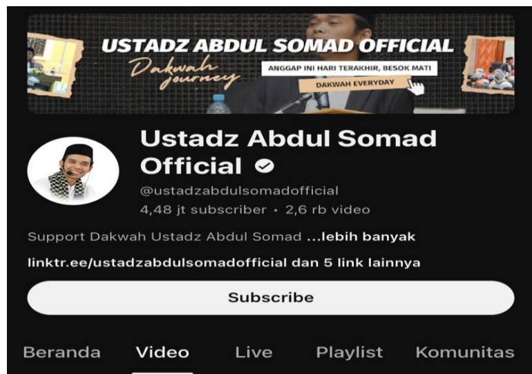
Gambar 4. Channel YouTube Ustaz Abdul Somad Official

Konten dakwah Ustaz Abdul Somad di Youtube dikemas dengan cara yang informatif, edukatif, dan menghibur. Cara penyampaian dakwahnya dengan gaya yang santai dan lugas, Ustaz Abdul Somad dikenal dengan gaya dakwahnya yang lucu dan menghibur. Beliau sering menyelipkan cerita lucu dalam dakwahnya untuk membuat suasana lebih santai dan menyenangkan.