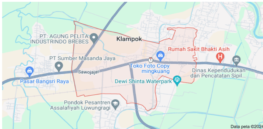
Gambar 11. Peta Desa Klampok

Desa Klampok terletak di Kecamatan Wanasari, Kabupaten Brebes, Jawa Tengah. Secara Geografis desa ini terletak pada dataran yang rendah yang mempunyai tanah subur, sehingga cocok untuk pertanian. Desa Klampok ini di kelilingi dengan beberapa desa lainnya, dan juga memiliki akses pantura yang biasa di lewati transportasi untuk menghubungkan dari kota ke kota. Desa Klampok sebelumnya bernama Bandarsari yang dilewati sebuah sungai diapit jalan raya dan jalan kereta api. Penduduk desa Bandarsari yang bermata pencaharian petani dan pedagang, memanfaatkan sungai tersebut untuk jalur perahu.