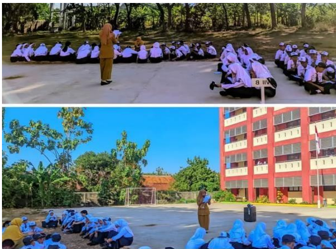
Gambar. 2.8 Kegiatan Siswa Literasi