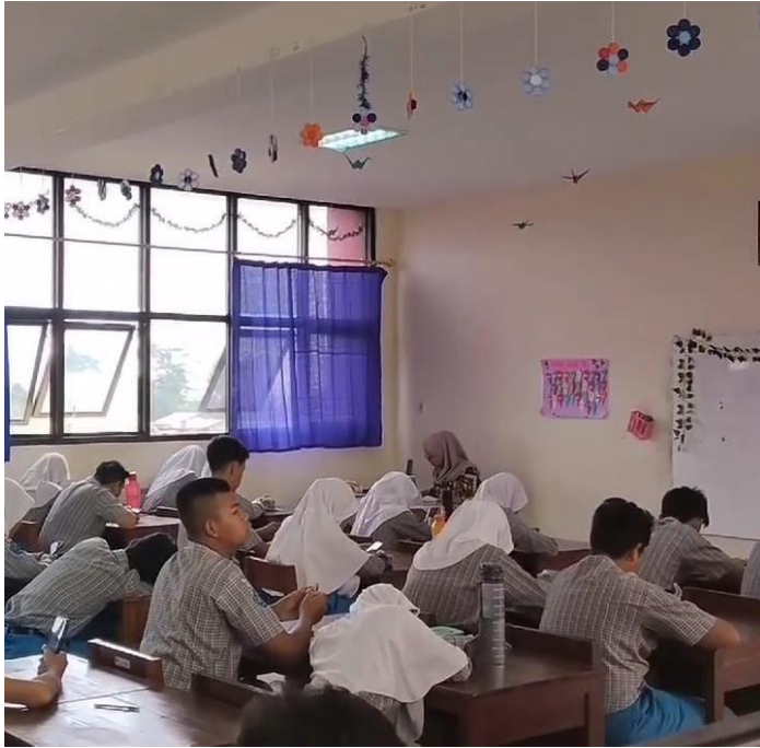
Gambar. 2.9 Suasana Pelaksanaan Belajar dikelas