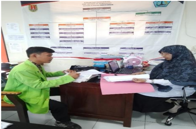
Gambar.2.2 Wawancara dengan Waka Kurikulum