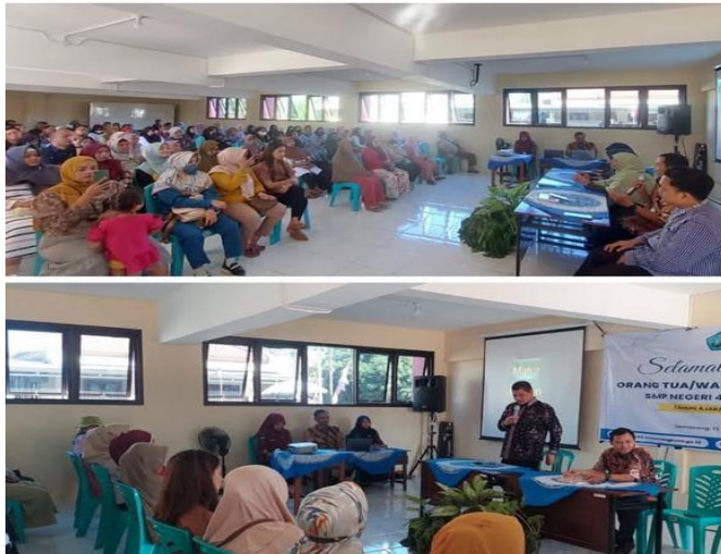
Gambar. 2.7 Pelaksanaan rapat dengan Orang tua Siswa