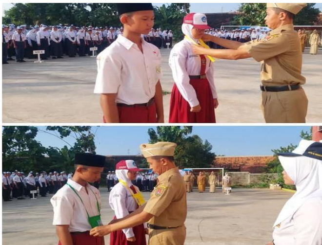
Gambar. 2.6 Pelaksaan Kegiatan MPLS