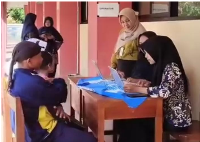
Gambarr. 2.5 Pelaksanaan PPDB Zonasi