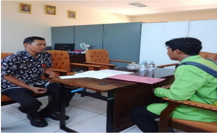
Gambar.2.1 Wawancara dengan Kepala Sekolah