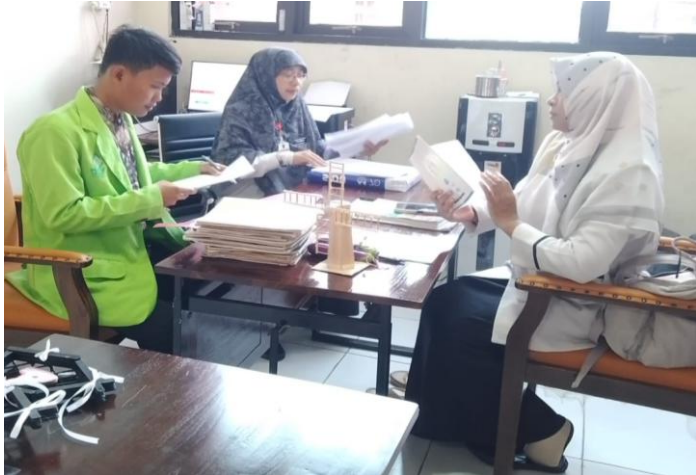
Gambar.2.3 Wawancara dengan Guru PAI