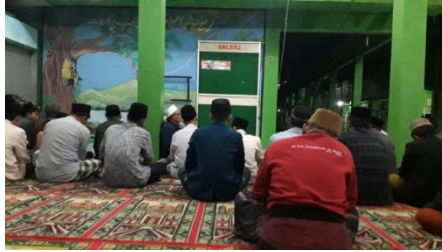
Rutinan Istighosah setiap Malam Senin di MA Plus Keterampilan Gajah Demak