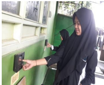
Absensi finger oleh peserta didik