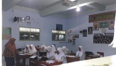
Suasana ruang kelas sebelum kegiatan KBM Suasana Ruang kelas