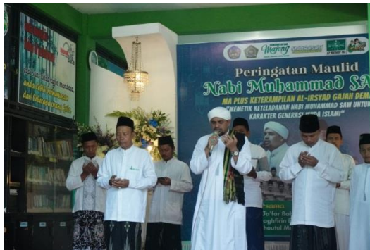
Dokumentasi Kegiatan Peringatan Maulid Nabi Muhammad SAW di MA Plus Keterampilan Al-Irsyad Gajah Demak.