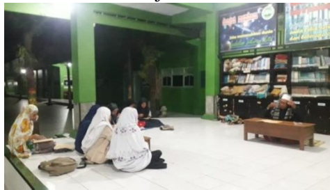
Kegiatan Ngaji Kitab Kuning di Pondok Tahfidz MA Plus Keterampilan Al-Irsyad Gajah Demak