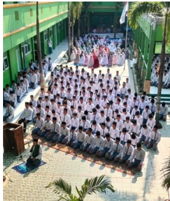
Kegiatan Sholat Dzhur Berjama'ah di Halaman Madrasah