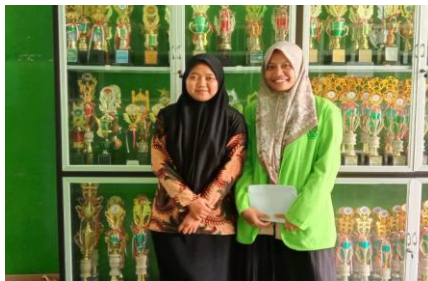
Wawancara Dengan Bu A'yun Selaku Guru PAI