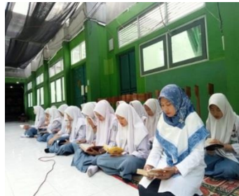
Dokumentasi kegiatan sholat dhuha berjama'ah Kegiatan Tadarrus dan Khotmil Qur'an