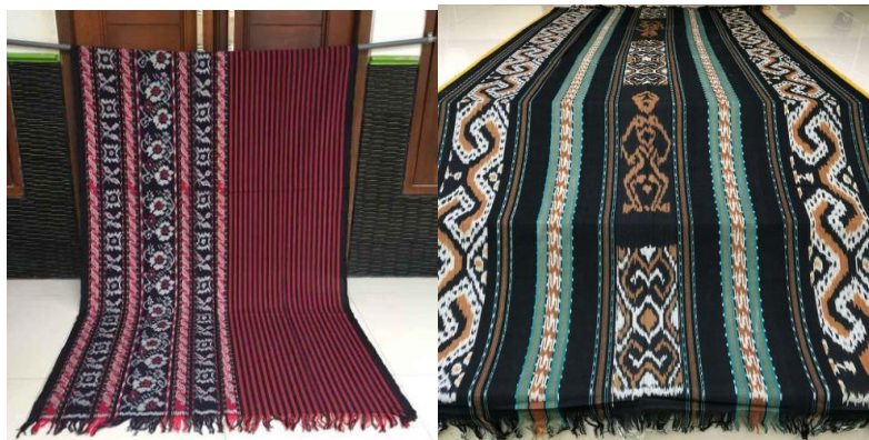
Gambar 4. 1 Gambar Pemasaran Kain Troso

pemerintah daerah bertujuan untuk meningkatkan visibilitas produk lokal dan memperluas jangkauan pasar. Langkah ini tidak hanya mendukung pertumbuhan ekonomi lokal tetapi juga membangun kesadaran masyarakat akan pentingnya mendukung produk-produk lokal yang berdaya saing. Dengan demikian, pemasaran menjadi salah satu sarana yang efektif dalam mendukung upaya pemberdayaan masyarakat dan pengembangan ekonomi lokal. Pemasaran mencakup berbagai elemen, termasuk penelitian pasar, perencanaan produk, penetapan harga, distribusi, promosi, dan pelayanan pelanggan (Darsana dkk, 2023).