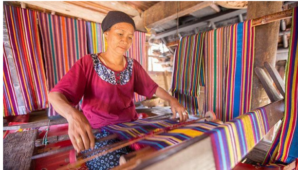
Gambar 4. 3 Pemberdayaan Perempuan