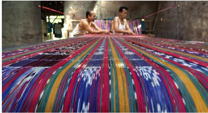
Gambar 4. 2 Pengembangan Inovasi Kain Troso

Peneliti juga menyoroti pentingnya pengembangan inovasi produk dalam menghadapi persaingan pasar yang semakin ketat. Dengan terus menggali potensi dan menciptakan produk-produk yang unik dan berkualitas, industri kerajinan lokal dapat memperluas pangsa pasar dan menjaga relevansinya di era yang terus berubah. Strategi ini tidak hanya menguntungkan bagi DM IKAT TROSO dan para pengrajin tenun secara ekonomi, tetapi juga memberikan nilai tambah bagi konsumen yang semakin menuntut inovasi dan nilai-nilai budaya dalam produk yang mereka beli.