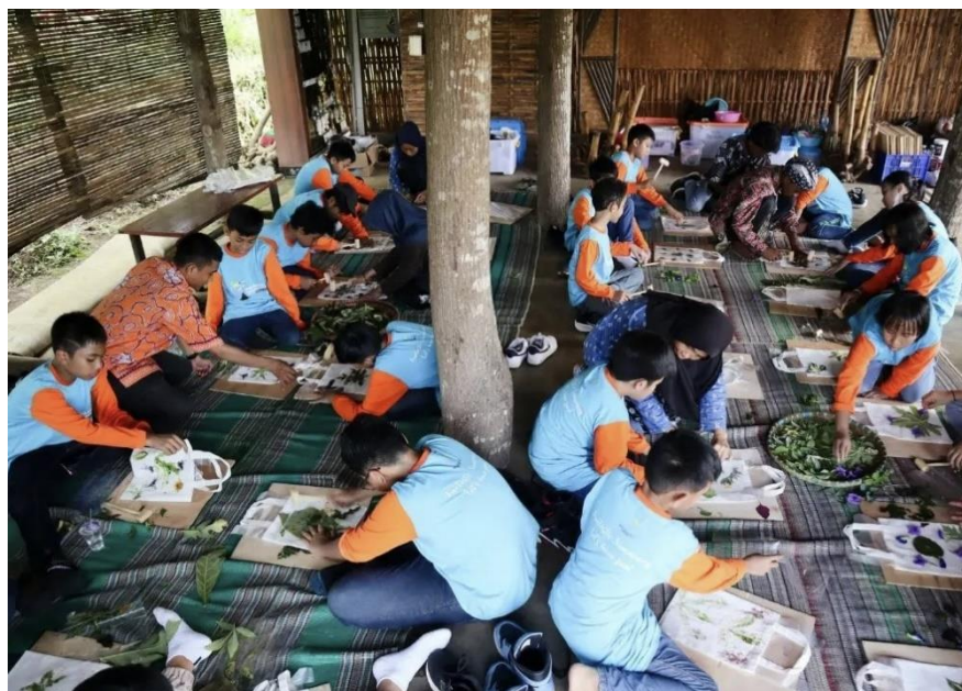
Proses kegiatan Batik Ecoprint