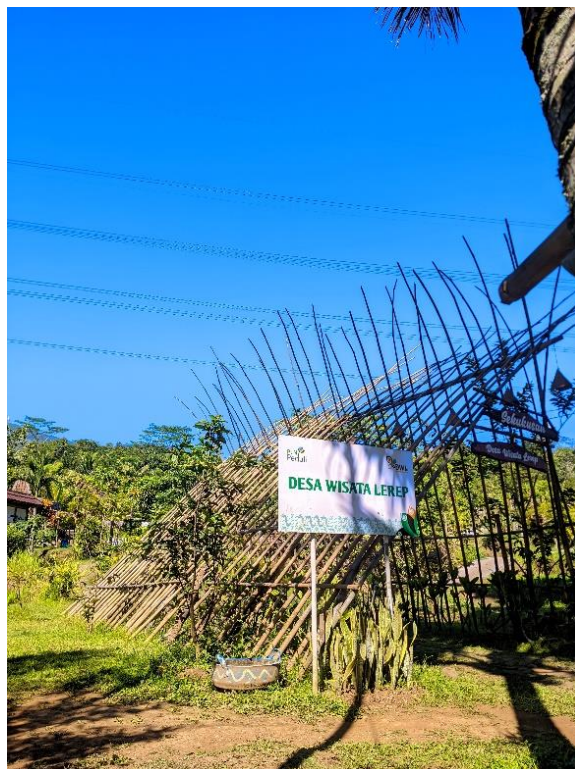
Profil Desa Wisata Edukasi Lerep