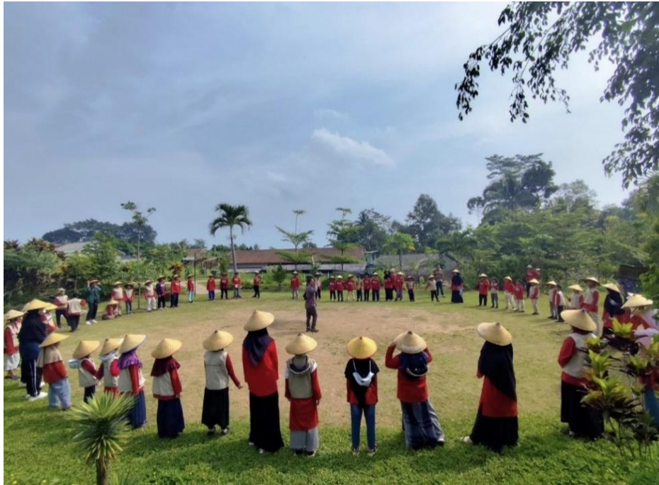
Tarian Cacing Gangsing untuk menyambut tamu