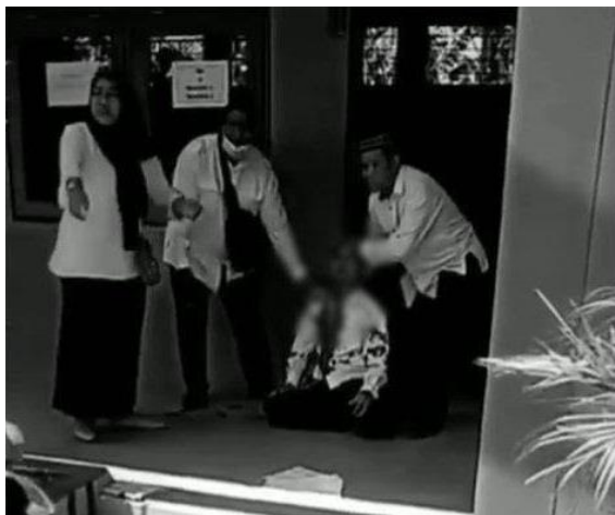
Gambar 4.1. Pembacokan Guru di MA Kabupaten Demak

Madrasah yang dianggap sebagai pilar utama pendidikan Islam di Indonesia dan sebagai benteng runtuhnya moral anak negeri ternyata mempunyai moral yang sangat buruk, nampak di diri kita sebagai lulusan madrasah harus menanggung opini masyarakat yang seolah-olah menyudutkan madrasah dan PAI dalam kasus ini. Maka dalam hal ini, kasus degradasi moral tengah menjadi problematika dan tantangan lembaga madrasah sendiri untuk mewujudkan lembaga pendidikan yang mempertahankan eksistensinya dengan ciri khas keislamannya.