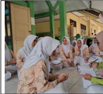
Wawancara Nyeri Haid (Dismenore)