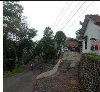
Gambaran Tempat Penelitian (SMP Negeri 4 Majenang)