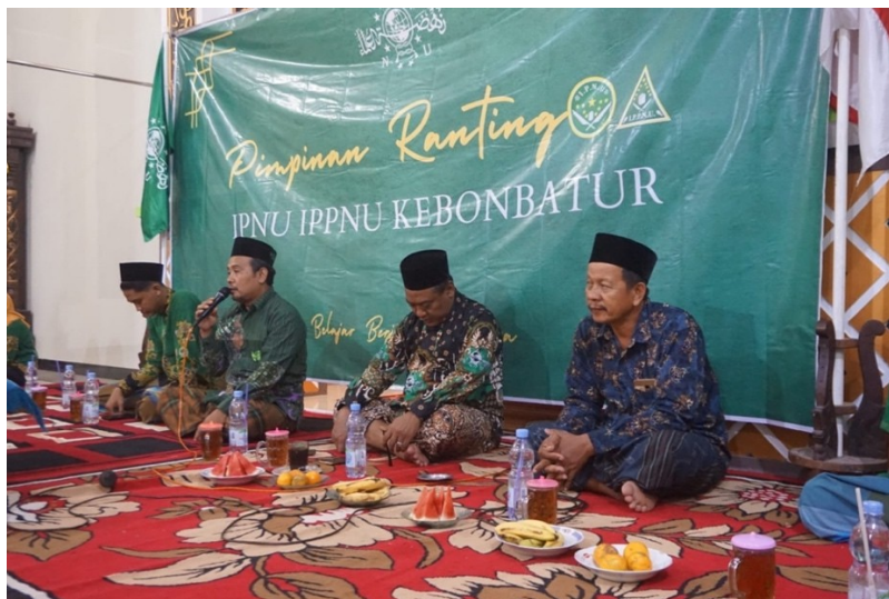
Gambar 5. 2 Pengajian Bapak-Bapak serta Anggota IPNU, IPPNU Desa Kebonbatur di Masjid

“Pengajian rutin tiap minggu itu ada, tapi tergantung di masing-masing RT. Kalau di RT 1 RW 4, pelaksanaan Fatayat dua kali dalam sebulan, dan yasinan seminggu sekali, biasanya di Masjid.” (Sharmadi, 12 Desember 2024)