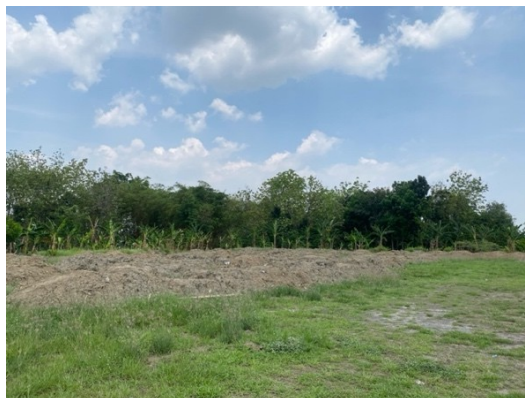
Gambar 5. 5 Lapangan Desa Kebonbatur

Melalui proyek upaya pembangunan lapangan dan gedung serbaguna menunjukkan komitmen Fatoni untuk menyediakan ruang publik yang dapat dimanfaatkan oleh masyarakat desa untuk berbagai kegiatan masyarakat, dari olahraga hingga pertemuan warga, Proyek ini diharapkan akan menjadi katalis bagi peningkatan interaksi sosial, pengembangan bakat pemuda dalam bidang olahraga, serta penyediaan tempat yang layak untuk berbagai acara kemasyarakatan. Sebagaimana perbaikan jalan telah memudahkan mobilitas dan mendorong aktivitas ekonomi, pembangunan fasilitas ini diproyeksikan akan membuka peluang baru bagi warga untuk berkumpul, berkegiatan, dan mempererat ikatan komunitas.