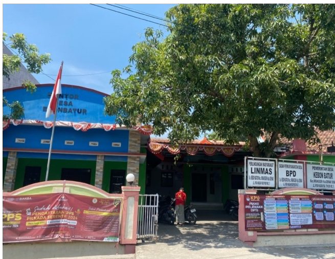
Gambar 3. 1 Balai Desa Kebonbatur

Desa Kebonbatur, terletak di wilayah selatan Kabupaten Demak, merupakan bagian dari Kecamatan Mranggen dengan luas wilayah mencapai 477,000 hektar. Desa ini memiliki kepadatan penduduk yang cukup tinggi, mencapai 15.567 jiwa. Meskipun memiliki potensi sumber daya alam yang besar, masih banyak potensi yang belum tergali. Sebagian besar wilayah Desa Kebonbatur (sekitar 167,000 hektar) merupakan lahan persawahan. Mata pencaharian penduduknya beragam, meliputi pedagang, pengrajin, PNS, penjahit, montir, sopir, karyawan swasta, tukang kayu, dan guru swasta (Dokumen Sekretaris Desa, 2024).