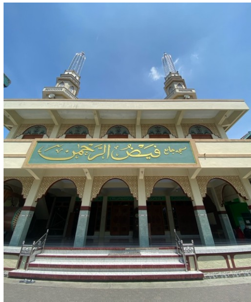
Gambar 4. 3 Masjid Faidurohman