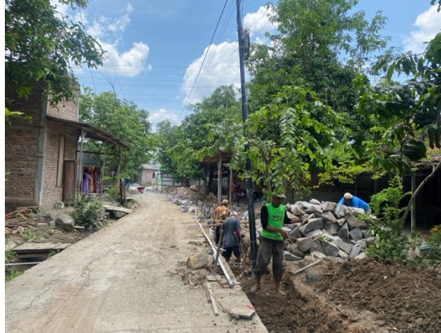
Gambar 5. 6 Pembangunan Talut Dukuh Kadilangon

bukti nyata dari komitmen dan visi kepemimpinan yang berorientasi pada kesejahteraan masyarakat dalam jangka panjang.