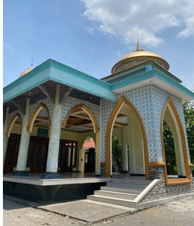
Gambar 4. 2 Masjid Nuruddin

dalam praktik-praktik ini mungkin memiliki akses lebih besar terhadap jaringan sosial, pengaruh, dan sumber daya lainnya di dalam komunitas.