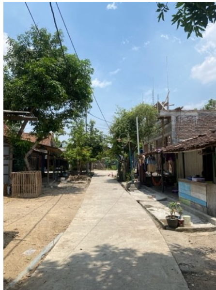
Gambar 5. 4 Jalan RT 1 RW 4

mentransformasi kondisi jalan di Desa Kebonbatur kini termanifestasi dalam infrastruktur yang telah mengalami peningkatan signifikan di sebagian besar wilayah desa. Kontras dengan era sebelum kepemimpinannya, di mana banyak akses desa berada dalam kondisi yang memprihatinkan dan sulit dilalui, sehingga menghambat tidak hanya mobilitas warga tetapi juga laju pertumbuhan ekonomi lokal. Melalui implementasi bertahap dari berbagai proyek perbaikan infrastruktur yang direncanakan dengan matang, Fatoni telah berhasil memastikan bahwa jaringan jalan penghubung di desa mengalami peningkatan kualitas yang signifikan, menciptakan fondasi yang kokoh bagi perkembangan desa di masa mendatang.