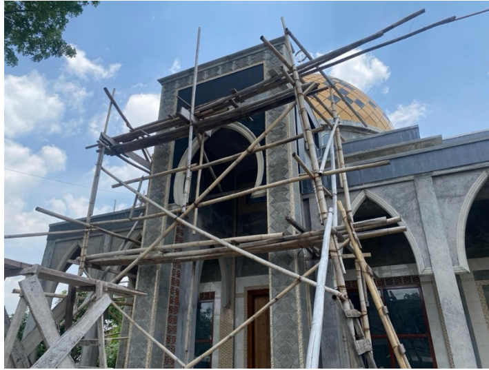
Gambar 5. 1 Masjid Baitus Salam