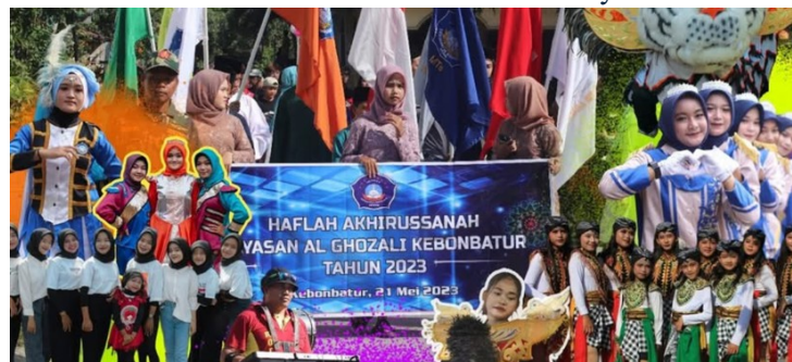
Gambar 4. 4 Karnaval Budaya

Pondok Pesantren Al-Ghazali menjadi acuan kultural Desa Kebonbatur. Sebagai satu-satunya pondok pesantren di desa tersebut, institusi ini tidak sekadar menjadi lembaga pendidikan keagamaan, melainkan juga pusat pemberdayaan dan ekspresi identitas masyarakat lokal. Kegiatan non-formal yang dikembangkan pesantren menunjukkan kompleksitas peran sosial yang diembannya. Pelatihan drum band, misalnya, menjadi media transformasi kreativitas anak-anak, mengintegrasikan tradisi musik modern dengan spirit pendidikan pesantren. Melalui kegiatan ini, anak-anak tidak hanya mengembangkan keterampilan musik, tetapi juga membangun kedisiplinan, kerja sama tim, dan apresiasi seni.