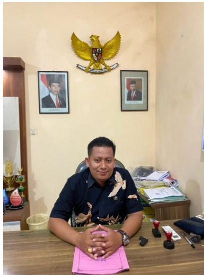
Gambar 3. 2 Kepala Desa Kebonbatur