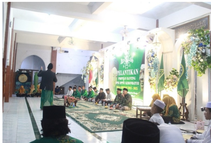
Gambar 5. 3 Pelantikan Pimpinan Ranting IPNU IPPNU

Praktik keagamaan di Desa Kebonbatur, khususnya pengajian dan tahlilan, menunjukkan struktur organisasi yang kuat dan komitmen warga terhadap tradisi yang mereka anut. Wawancara dengan Sharmadi, tokoh agama Desa Kebonbatur, mengungkapkan bahwa baik para bapak maupun ibu memiliki jadwal khusus untuk mengadakan tahlilan, mencerminkan kesungguhan mereka dalam menjalankan kewajiban agama. Sebagai contoh, RT 1 RW 4 di desa ini secara rutin mengadakan pengajian untuk ibu-ibu, dengan frekuensi yang bervariasi, kadang sebulan sekali, kadang sebulan dua kali. Acara ini bukan hanya berfungsi sebagai wadah untuk mencari ilmu, berdoa, dan mengenang orang yang telah meninggal, tetapi juga merupakan sarana untuk memperkuat solidaritas dan ikatan sosial di antara warga desa. Struktur jadwal yang teratur mencerminkan kedisiplinan dan kesungguhan warga dalam menjalankan praktik keagamaan mereka, sambil menegaskan pentingnya nilai-nilai kebersamaan dan keagamaan dalam kehidupan sehari-hari di Desa Kebonbatur.