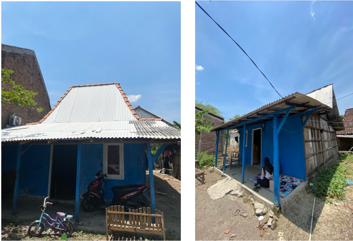
Gambar 5. 10 Rumah yang dibangun melalui program RTLH