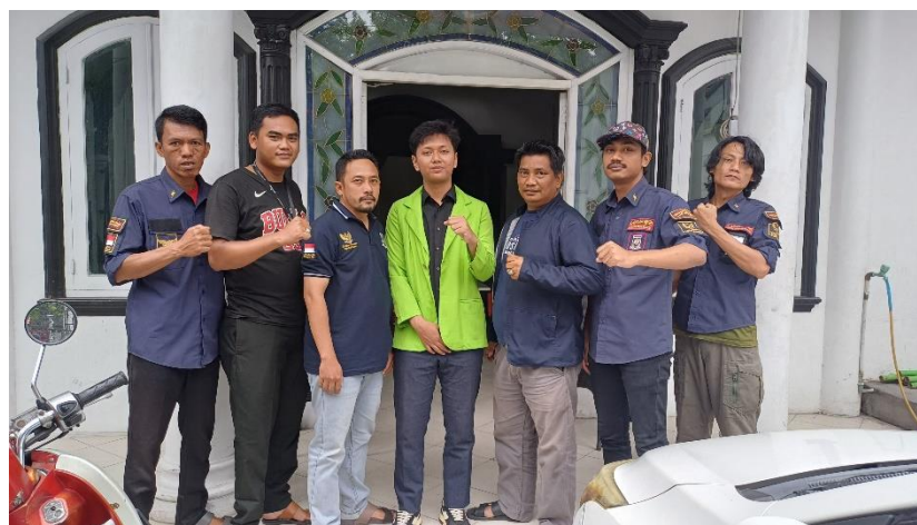
Wawancara dengan LSM Laskar NKRI