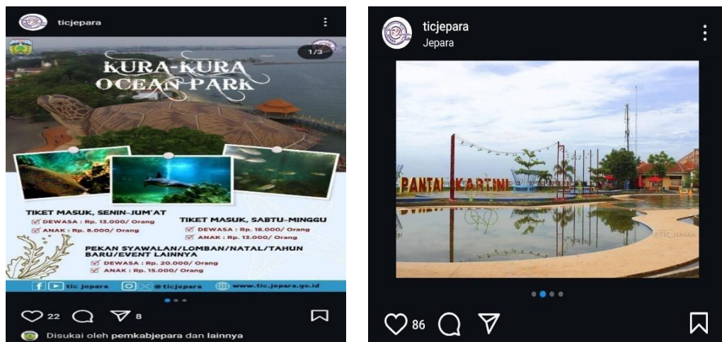
Gambar 14. Pemasaran dan Promosi Pantai Kartini melalui Media Sosial

Pihak pengelola juga memanfaatkan fitur Instagram Stories dan Reels yang memungkinkan konten video pendek tentang keindahan Pantai Kartini tersebar lebih luas dan cepat. Dengan cara ini, mereka berhasil menarik perhatian generasi muda yang lebih aktif di platform media sosial. Lebih lanjut, selain promosi melalui media sosial, Kegiatan budaya lokal juga menjadi salah satu media promosi. Strategi promosi ini, yang memadukan kekuatan media sosial dengan aktivitas di lapangan, telah membantu Pantai Kartini mempertahankan daya tariknya di tengah persaingan destinasi wisata lain di daerah tersebut.