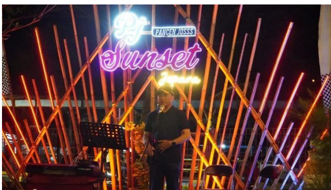
Gambar 15. Pancen Jos (PJ) Sunset 1 yang Ada di Pantai Kartini

Promosi kawasan wisata Pantai Kartini juga dilakukan melalui acara dan komunitas seni serta budaya yang merupakan strategi efektif. Kegiatan semacam ini menarik dan meningkatkan jumlah pengunjung serta dapat mengundang beberapa media sehingga menjadi bagian dari promosi wisata. Dengan dukungan dari para seniman, Pantai Kartini semakin populer sebagai destinasi wisata yang sarat seni dan budaya. Beberapa acara seperti pertunjukan musik dan pameran seni tidak hanya menyuguhkan karya seni tetapi juga mendorong interaksi antara seniman dan pengunjung. Dengan demikian, setiap acara memberikan pengalaman yang unik dan menyenangkan bagi para pengunjung.