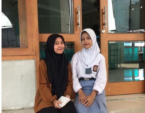
Gambar 4 Kegiatan Hari Santri