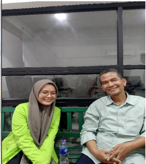
Wawancara Guru PAI