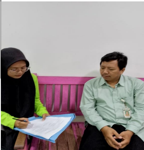
Wawancara Koordinator BUSI