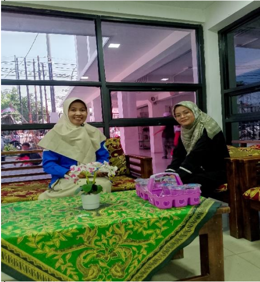
Wawancara Kepala Sekolah