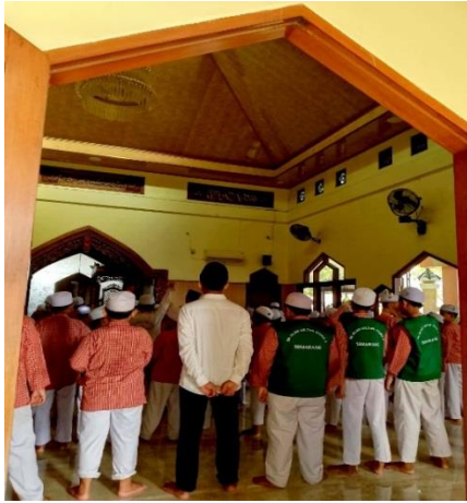
Budaya Shalat Berjamaah