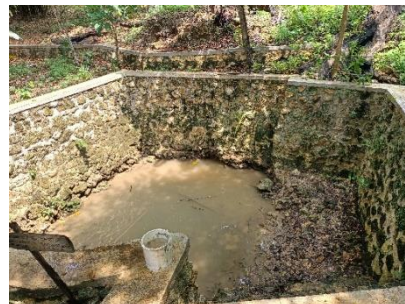
Mata Air Sokadana yang Mengering