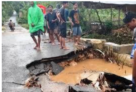
Gambar 3.2 Jembatan ambrol akibat banjir bandang

“Banjir bandang yang menerjang Desa Prawoto pada hari Jum’at, 16 Desember 2022, sekitar pukul 17.00 WIB disebabkan oleh hujan deras yang mengguyur wilayah Pati selama beberapa jam. Intensitas hujan yang sangat tinggi menyebabkan volume air di sungai yang melintasi Desa Prawoto meluap secara drastis, sehingga air menggenangi area sekitarnya. Dampak dari banjir bandang ini adalah kerusakan pada jembatan yang menghubungkan Desa Prawoto dengan Desa Pakem. Jembatan yang sebelumnya menjadi jalur utama masyarakat Dusun Sawahan dan Pesapen kini tidak dapat dilalui, karena jembatan tersebut ambrol dan aspalnya mengelupas, sehingga transportasi yang melewati jembatan tersebut menjadi terhambat” 14