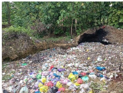
Tumpukan Sampah Rumah Tangga di Lahan Milik Orang