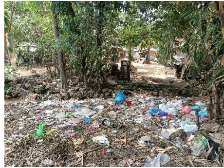
Gambar 3.5 Tumpukan Sampah di Pekarangan