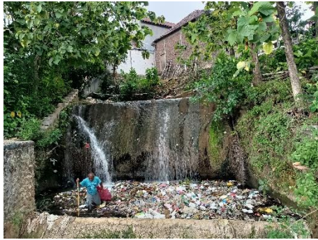
Gambar 3.4 Tumpukan Sampah di Sungai