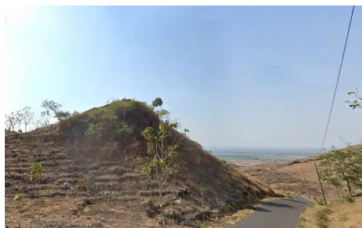
Gambar 3.1 Kondisi Hutan Pegunungan Kendeng

Hutan yang gundul di daerah hulu atau kawasan Pegunungan Kendeng merupakan dampak dari aktivitas manusia yang tidak peduli akan pentingnya menjaga keseimbangan lingkungan. Berdasarkan data yang diperoleh penulis melalui wawancara dengan Bapak Haryanto, bahwasannya pernah terjadi penjarahan atau eksploitasi hutan jati milik perhutani yang berlangsung sekitar tahun 1998 hingga awal tahun 2000. 9 Setelah terjadinya perusakan hutan jati seluas kurang lebih 788