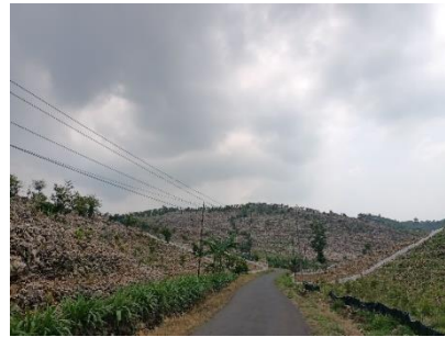
Gundulnya Hutan di Pegunungan Kendeng