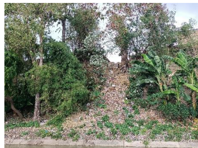
Tumpukan Sampah di Jurang Dekat Sungai