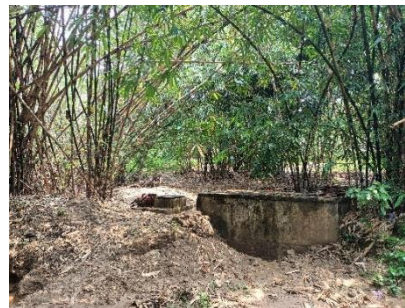
Penampungan Air di Sumber Mata Air Sokadana