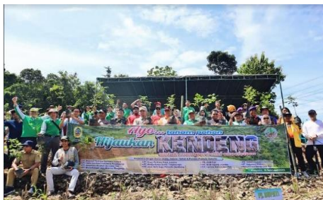
Kegiatan Penanaman Pohon di Kawasan Pegunungan Kendeng bersama DLH Kabupaten Pati