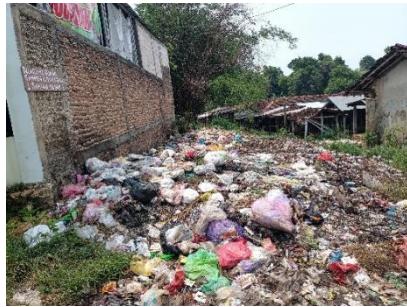
Tumpukan Sampah Pasar