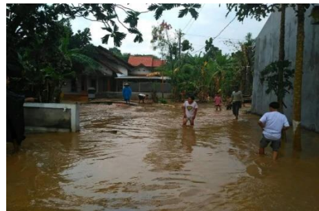
Gambar 3.3 Halaman rumah warga tergenang banjir

Sebelumnya, pada tahun 2011, Desa Prawoto mengalami bencana banjir bandang yang menjadi salah satu peristiwa memilukan dalam sejarah desa Prawoto. Hujan deras mengguyur tanpa henti pada Sabtu sore, 12 Desember 2011 yang menyebabkan tanggul Sungai Guyangan jebol. Akibatnya, air meluap dengan sangat cepat dan membanjiri pemukiman warga Dusun Klantangan bagian bawah. Peristiwa ini tidak hanya membawa kerugian materill, tapi juga meluluhlantakkan kehidupan masyarakat yang terdampak. Salah satu rumah yang mengalami kerusakan parah adalah milik seorang warga bernama