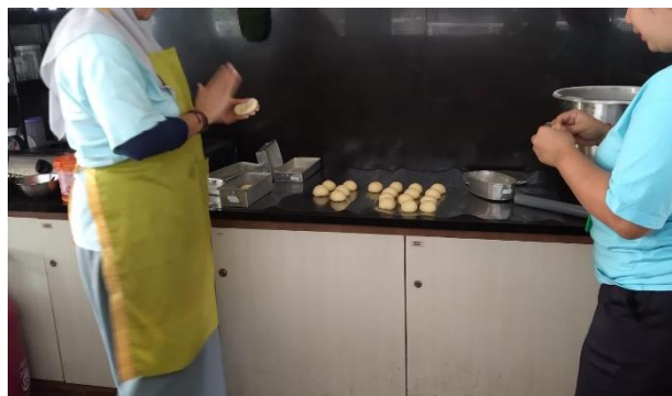
Wawancara dengan Narapidana Ibu YN dan NK