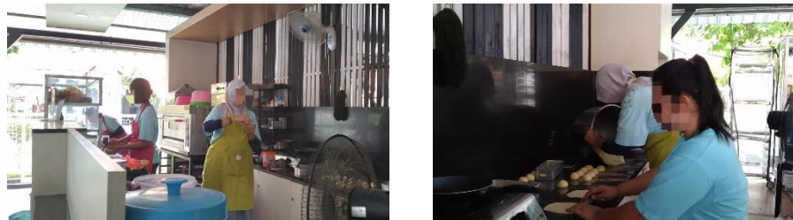
Gambar 1.3 Proses Pembuatan Bakery