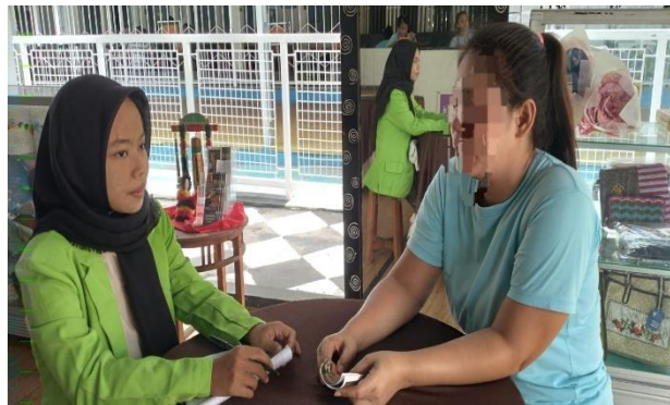
Wawancara dengan narapidana ibu YN