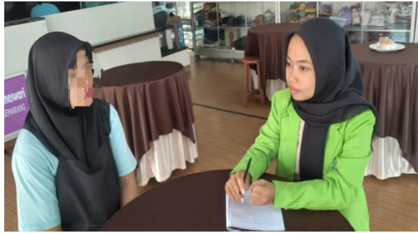
Wawancara dengan Narapidana Ibu FY