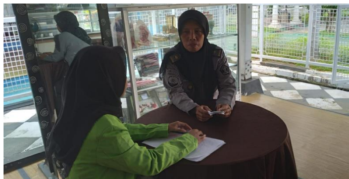
Proses Wawancara dengan kepala kasi bimbingan Kerja