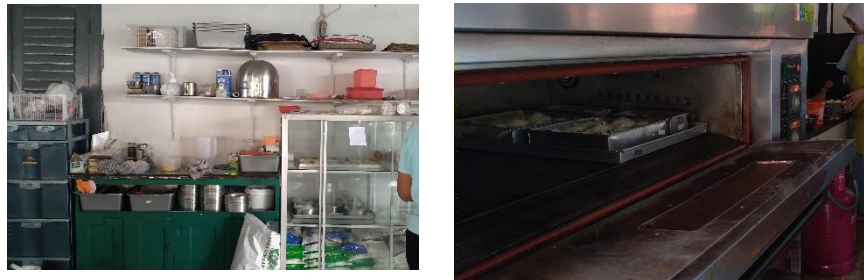
Gambar 1.2 Alat dan Bahan Proses Pembuatan Bakery

Pernyataan dari Ibu Rini Sulistiyowati selaku Kepala Kasi Bimbingan Kerja menjelaskan tentang bahan baku yang digunakan untuk proses pembuatan bakery tersebut berasal dari dana Lapas, dan peralatan-peralatan yang digunakan berasal dari donasi pihak luar. Dukungan ( support ) langsung dari masyarakat luar dan pihak eksternal sangat berarti dalam menyediakan fasilitas dan peralatan yang dibutuhkan untuk program pembinaan keterampilan di Lapas, meskipun masih dalam kondisi terbatas namun upaya untuk terus meningkatkan fasilitas tersebut dapat memberikan dampak positif dalam pemberdayaan WBP di LPP Semarang.