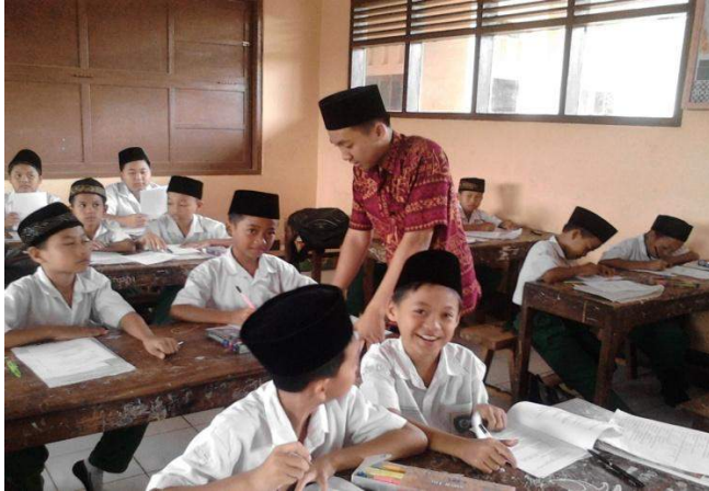
Menerangkan pengisian angket