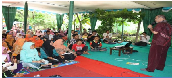
Kegiatan dialog Parenting untuk guru