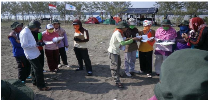
Kegiatan Pelatihan out bond yang dilakukan diluar Sekolah