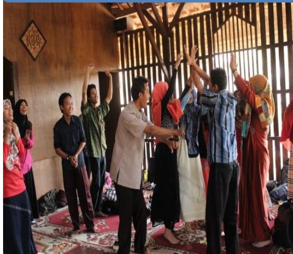
Kegiatan games guru Sekolah Alam Auliya