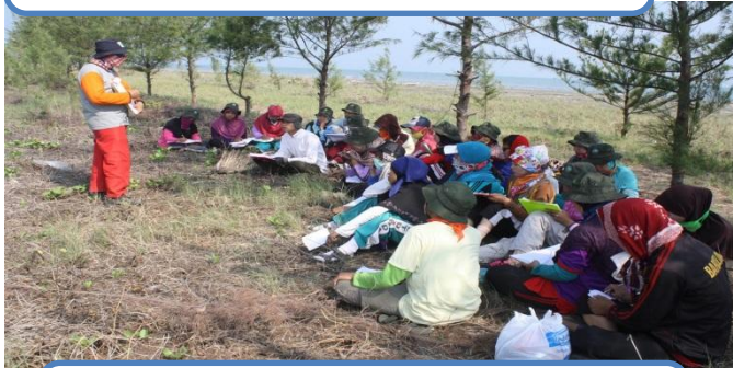
Kegiatan Pelatihan yang dilakukan diluar Sekolah