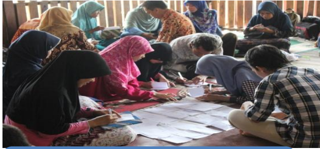
Kegiatan Pelatihan B3 di Masjid Sekolah Alam Auliya