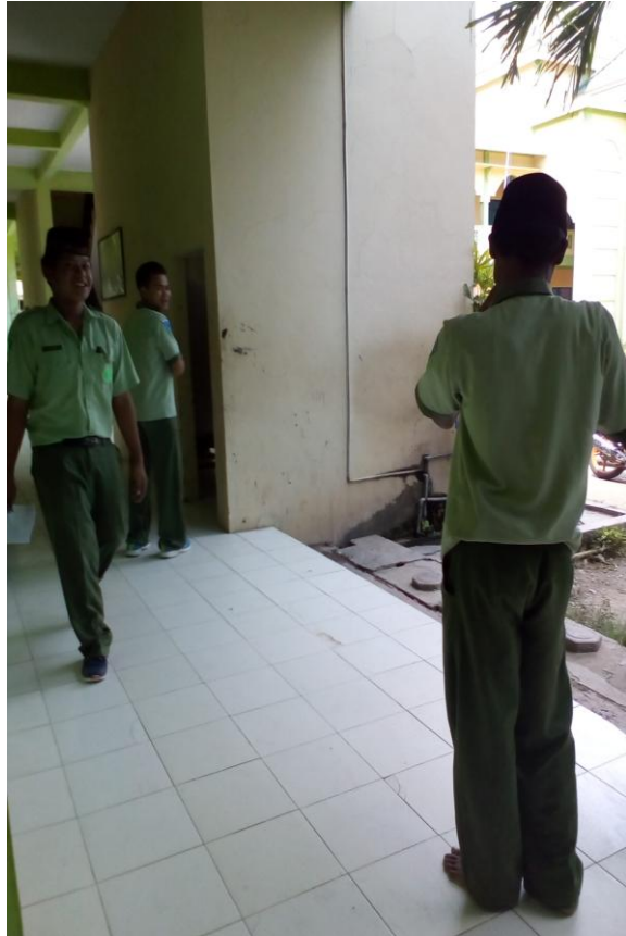
siswa tidak memasukkan baju atasan saat jam sekolah