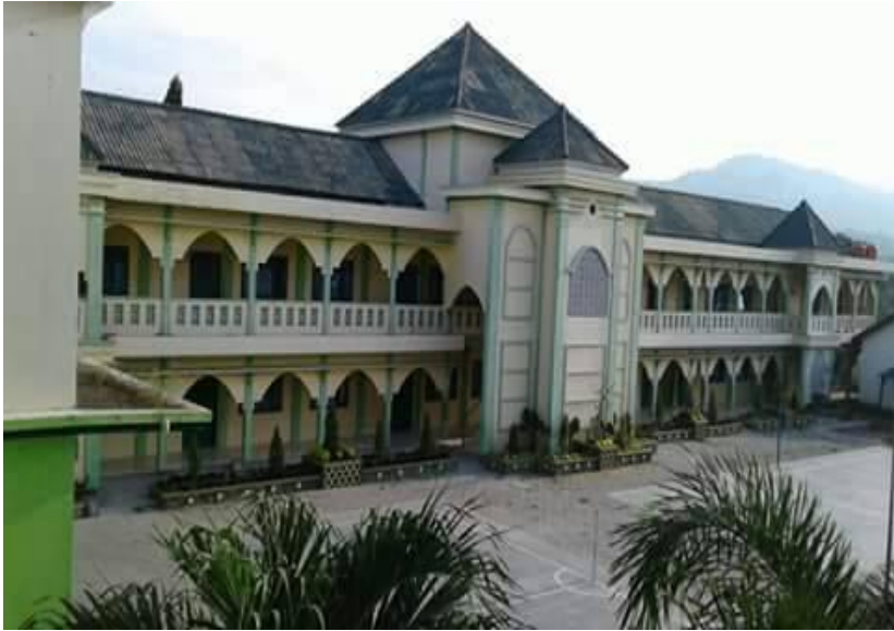
Gedung proses KBM MA YSPIS Rembang