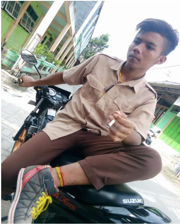
siswa keluar madrasah saat jam sekolah