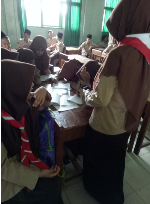
siswi memainkan ponsel saat jam sekolah