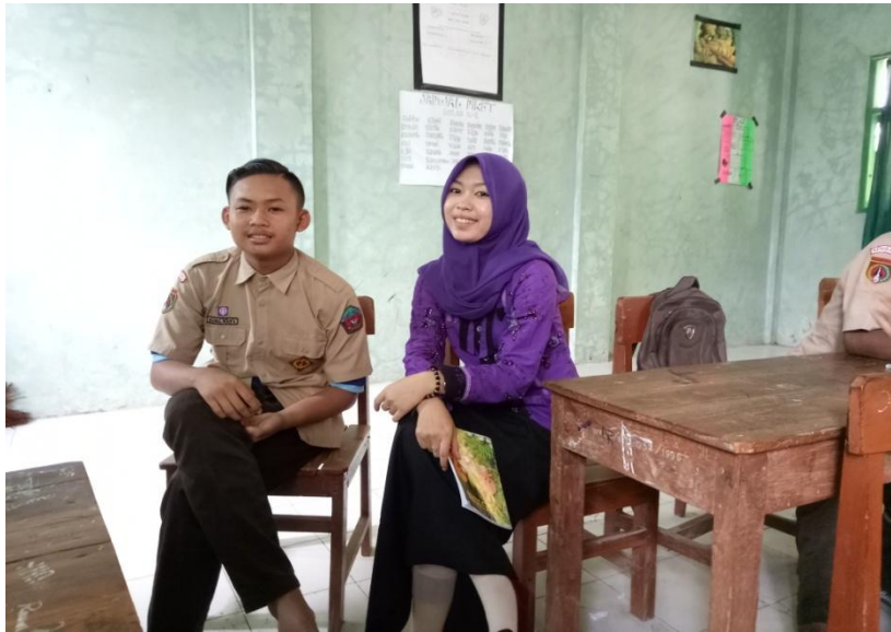
Selesai wawancara dengan siswa MA YSPIS Rembang