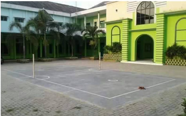
Halaman MA YSPIS Rembang