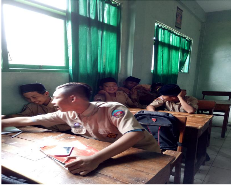
siswa tidak memakai peci saat jam pelajaran