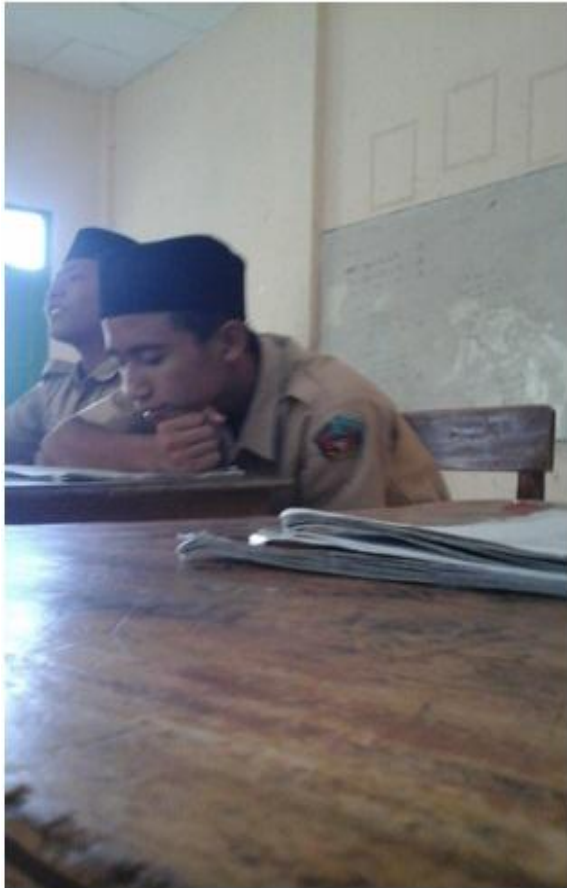
siswa mengerjakan tugas tambahan dari guru