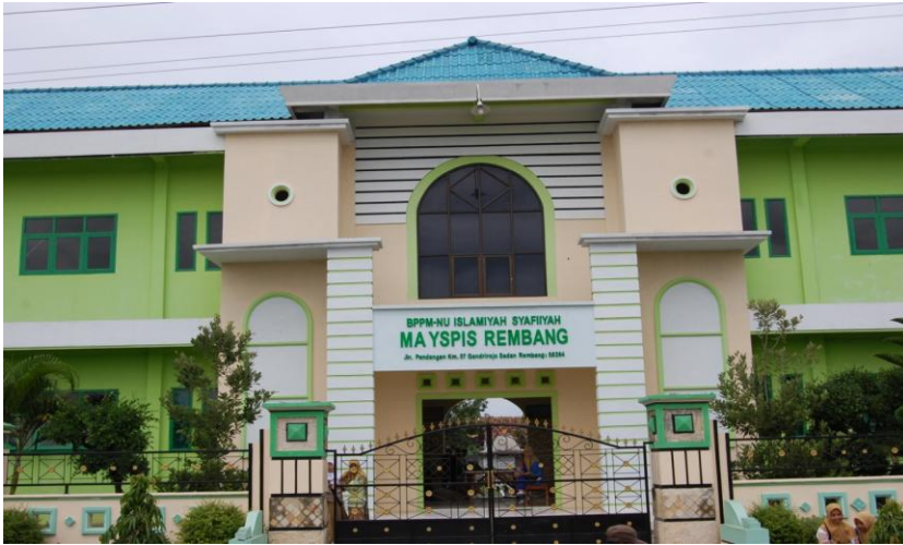
Gedung Ma YSPIS Rembang tampak dari depan