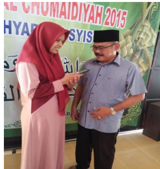
Foto kegiatan Manasik Bimbingan Ibadah Haji