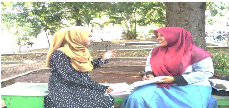
Wawancara dengan mahasiswa PBA 3C