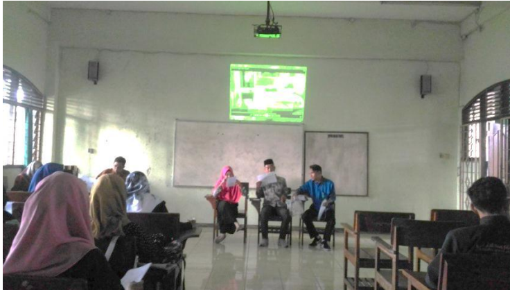
Penyaji sedang menjelaskan materi yang telah diperdengarkan