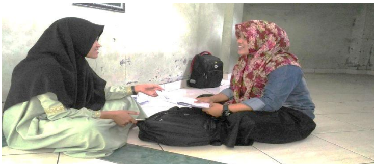
Wawancara dengan mahasiswa PBA 3C