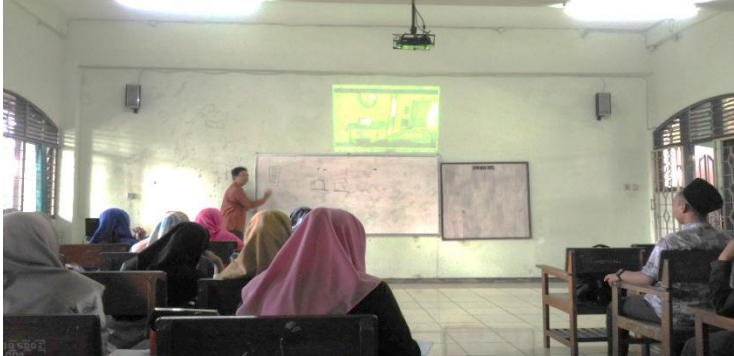
Dosen sedang menjelaskan kembali materi yang telah didiskusikan