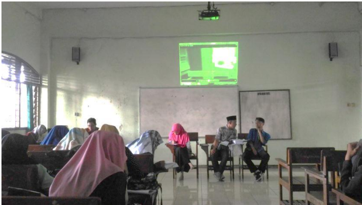
Penyaji sedang mendiskusikan materi dengan teman kelompoknya