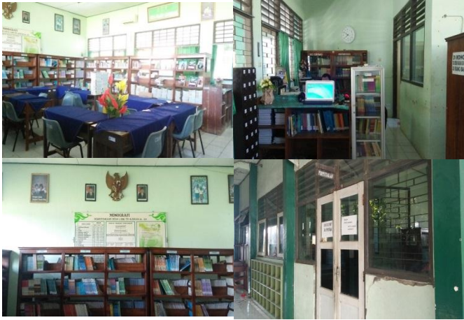
الصورة ٤.١. المكتبة

تقع المكتبة بجوار المعمل اللغة وبدلا من الذهاب داخل. توفر المكتبة جميع الكتب الدراسية بما في ذلك كتب اللغة العربية. عندما يبدأ العام الدراسي الجديد ، يُطلب من كل الطلاب استعارة كتاب في المكتبة بالكامل (جميع المواد الدراسية). جاءت الكتب التي قدمتها المدرسة من الحكومة ويتم توفير الكتب الدينية مثل اللغة العربية من وزارة الدين. بالإضافة إلى الكتب المدرسية ، فإنه يوفر أيضا الكتب الأخرى لإضافة البصيرة ، بالطبع الكتب المفيدة.