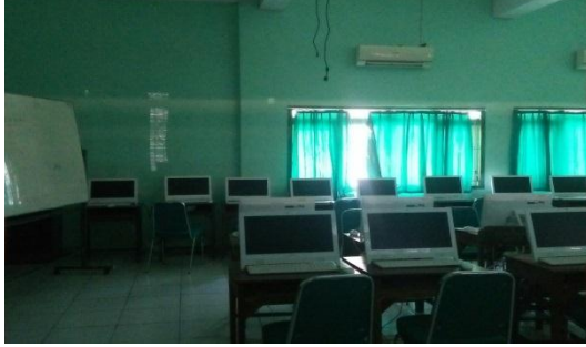
الصورة ٤.٣ . معمل الكمبيوتر