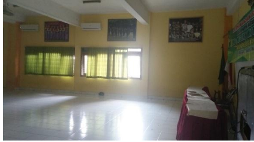
الصورة ٤.٥. القاعة

ب. تحليل البيانات عن استعداد المدرس والطلاب ووسائل التعليمية