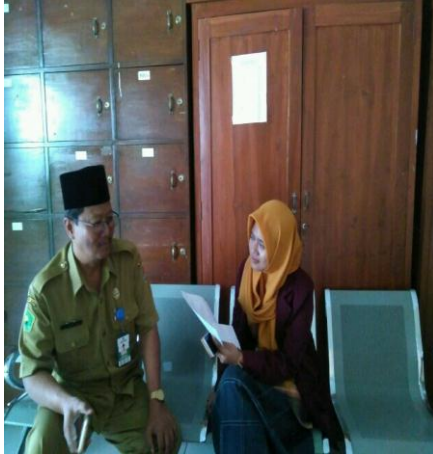
Gambar 1. Wawancara dengan para guru