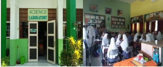
الصورة ٤.٢. معمل العلوم الطبيعية

معمل علوم الطبيعة هو مكان لممارسات تعليم العلوم الطبيعية مثل الكيمياء والفيزياء والبيولوجيا. يقع معمل علوم الطبيعة بين غرفة مجلس الطلبة والفصل الثامن. بالإضافة، يستخدم معمل علوم الطبيعة لممارسة المواد علوم الطبيعة، هذا معمل متعدد الوظائف لممارسة التعلم الحرّي. وهي مجهزة بأدوات لممارسة تعليم العلوم الطبيعية أو الحرف اليدوية.