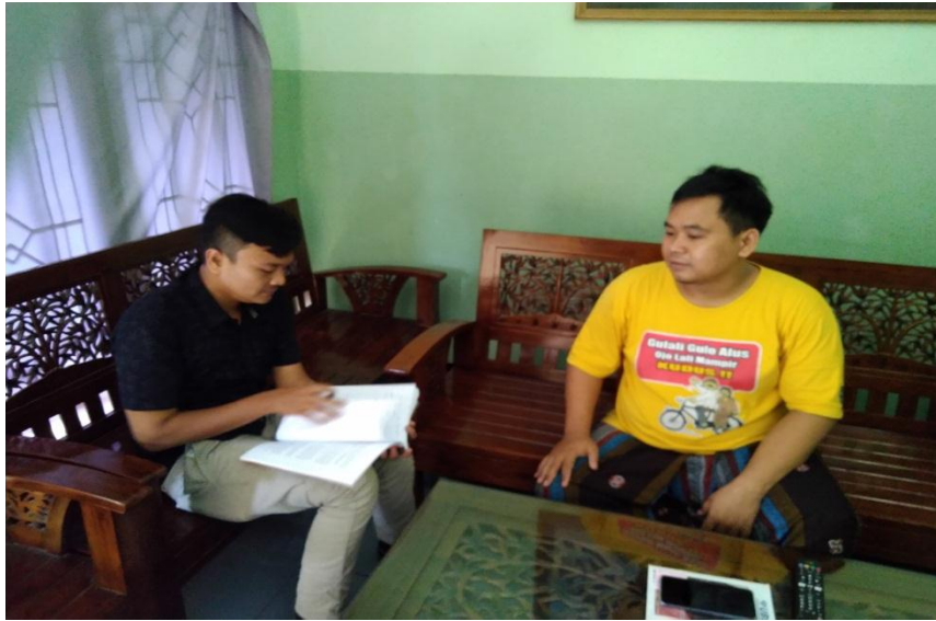
Gambar 3: wawancara dengan nasabah