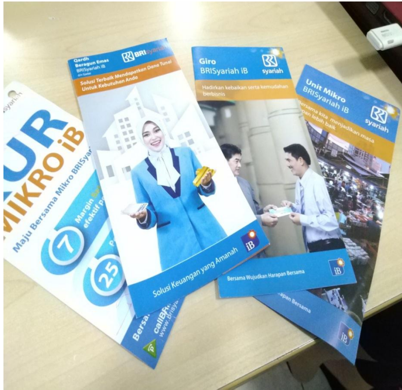
Gambar 1 :unit usaha KUR mikro iB BRI SYARIAH