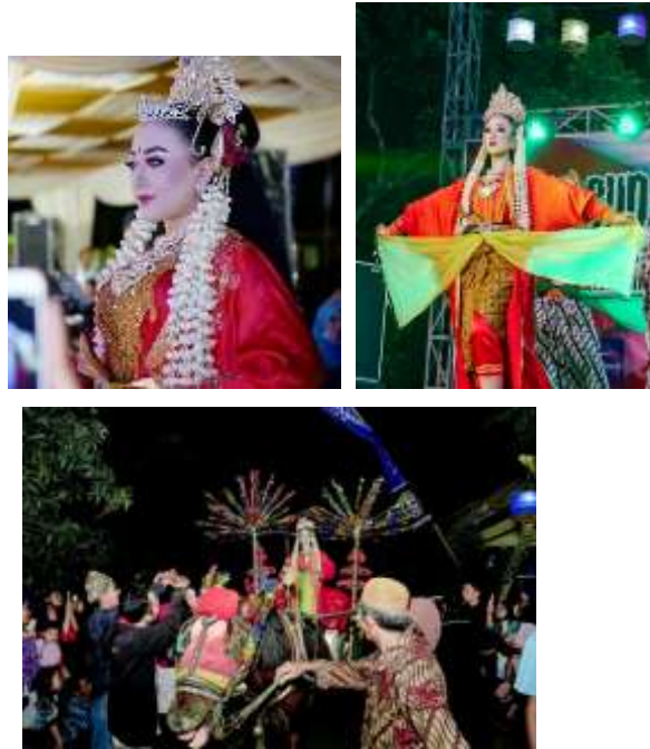
Gambar 11. Anastasya sebagai simbol Ratu Kalinyamat