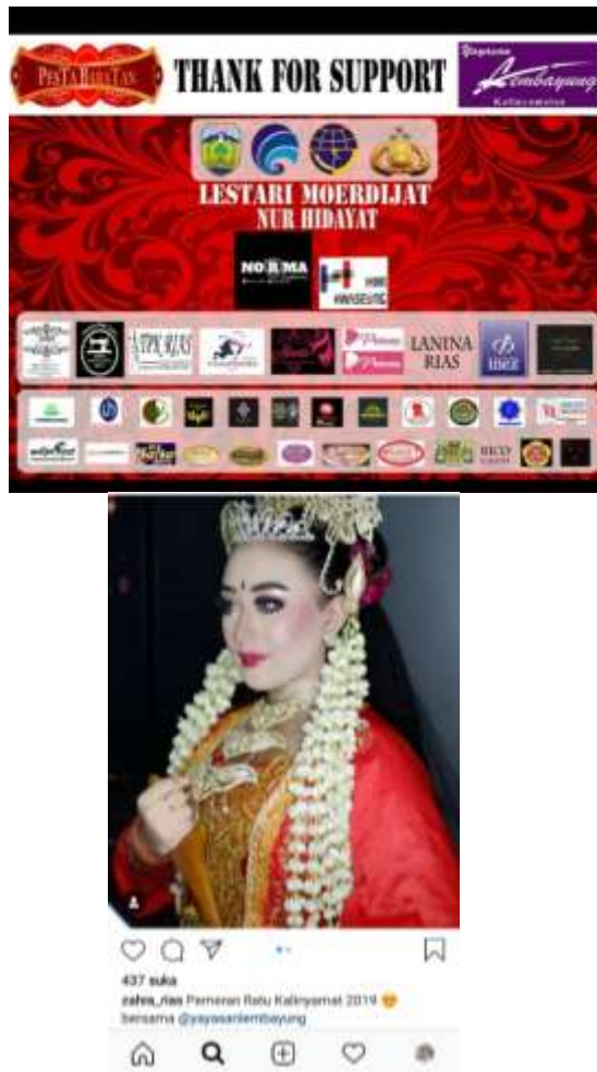
Gambar 5. Banyaknya Sponsor yang Melakukan Promosi Brand/Merek pada Saat Pelaksanaan Festival Budaya Tahunan Tradisi Baratan