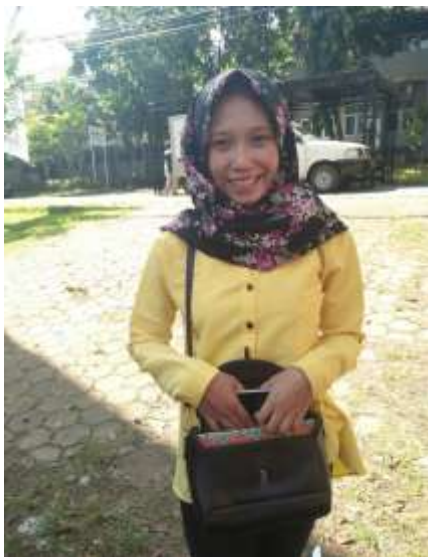
Wawancara dengan Devi