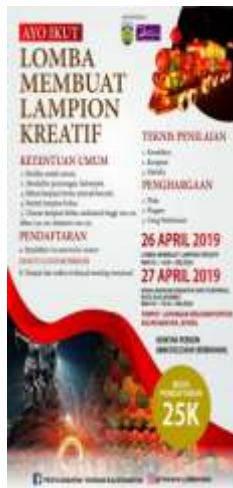
Gambar 6. Lomba Membuat Lampion Kreatif dan Penjurianya Tahun 2019