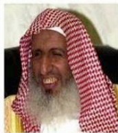
Gambar 11.7 Muhammad bin Abdul Wahab

Di Arabia timbul suatu aliran Wahabiyah, yang mempunyai pengaruh pada pemikiran pembaharuan di abad ke-19. Pencetusnya ialah Muhammad bin Abdul Wahab (1703-1787) yang lahir di Uyainah, Nejd, Arab Saudi. Setelah menyelesaikan pelajarannya di Madinah ia pergi merantau ke Basrah dan tinggal di kota ini selama empat tahun. Selanjutnya ia pindah ke Bagdad dan di sini ia menikah dengan seorang wanita kaya. Lima tahun kemudian, setelah istrinya meninggal dunia, ia pindah ke Kurdistan, selanjutnya ke Hamdan, dan ke Isfahan. Di Kota Isfahan, ia sempat mempelajari filsafat dan tasawuf. Setelah bertahun-tahun merantau, ia akhirnya kembali ke