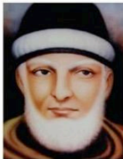
Gambar 11.8 Syah Waliyullah

Di antara penyebab yang membawa kepada kelemahan dan kemunduran umat Islam menurut pemikirannya adalah sebagai berikut.