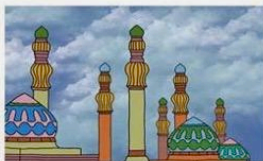
Gambar 10.6 Bangunan masjid dengan berbagai menara

Islam pada periode ini dikenal dengan era kebangkitan umat Islam. Kebangkitan umat Islam disebabkan oleh adanya benturan antara kekuatan Islam dengan kekuatan Eropa. Benturan itu menyadarkan umat Islam bahwa sudah cukup jauh tertinggal dengan Eropa. Hal ini dirasakan sekali oleh Kerajaan Turki Usmani yang langsung menghadapi kekuatan Eropa